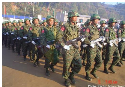
KIA troops.

When RFA asked how he would like to assess the current revolution that is now affecting countrywide, he replied: "The current situation is the showdown that will end the dictatorship and could say it is at its concluding phase. Because in the past, there was no such countrywide resistance-revolutionary situation. This time, as revolution and resistance are happening all over the country without exception, we can consider this as the last showdown that would end the dictatorship."