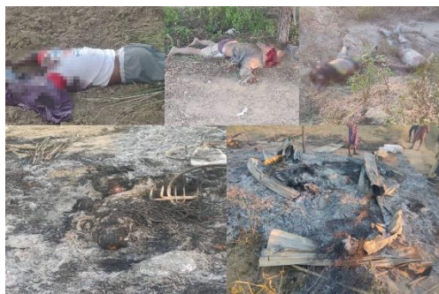
Bodies found near Htan Lay Pin after the military's departure

“They were decapitated, or had their limbs amputated,” he explained. “Some tried to flee by jumping into the [Chindwin] river and it appears that the military captured them anyway and mutilated them. Some witnesses saw the military shooting and capturing our members that were running into the river.”