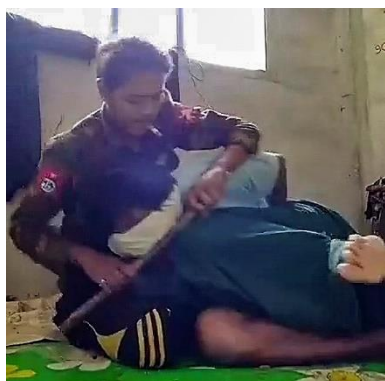
The captive struggles as the interrogator chokes him with a rod.

The brutal interrogation was shared with RFA in seven videos that run for a total of about 17 minutes, all in the single, sunlit room. The man in the military jacket smokes in one sequence and pauses to eat something in another. He alternately seems bored, frustrated and indifferent as he uses the rod to strike and choke his cowering victim.