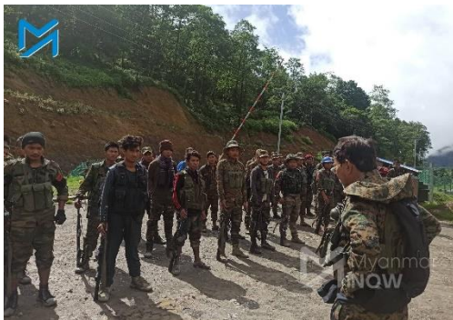
CNF troops on the frontlines in 2022

On Tuesday, the Chin Human Rights Organization posted leaked documents on Twitter that showed the military’s plans for airstrikes on Camp Victoria, the CNF’s command centre.