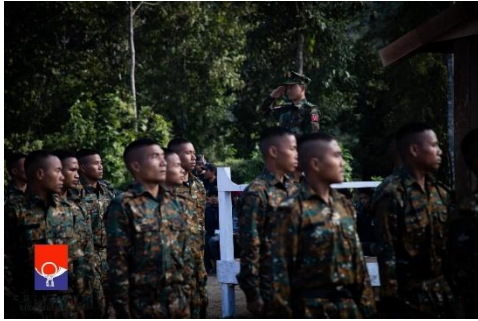
CNF troops attend a ceremony for graduates of a basic military training course in December 2021

“No one was injured and everyone is safe, as we built our base to withstand such attacks. There wasn’t any fighting taking place. They just decided to bomb us for no reason,” he said.