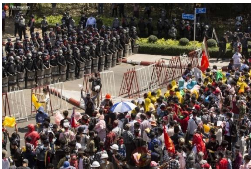
၂၀၂၁ ခုနှစ် စစ်အာဏာသိမ်းမှုကို ဆန့်ကျင်နေသည့် မဲဆန္ဒရှင် ပြည်သူများ