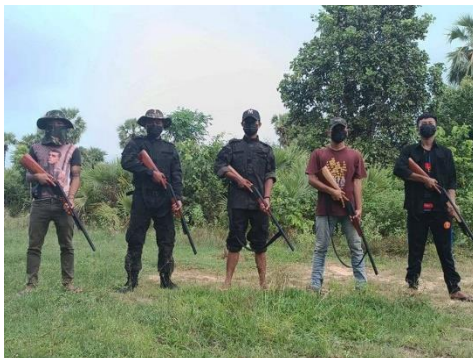
Fighters of Taze-PDF group armed with improvised firearms.

At least three junta soldiers were killed in Taze Township, Sagaing Region on Tuesday when Taze-PDF conducted two land-mine ambushes against a military detachment and a pro-regime militia group, the PDF group claimed.