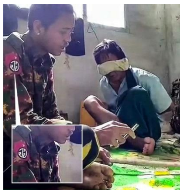
A Myanmar military patch is seen on the arm interrogator's jacket.

The Institute for Strategy and Policy (ISP Myanmar) said in a report last spring that at least 5,646 civilians in the country had been killed between the Feb. 1, 2021, coup and early May.