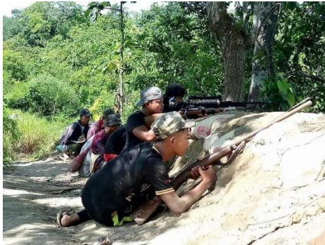
Resistance fighters of Golden Triangle Forces during an ambush in Sagaing Region.

A regime soldier was injured in Monywa Township, Sagaing Region on Monday when two PDF groups fired four 40-mm explosive rounds at regime forces stationed at the government residence in the town of Monywa, claimed the resistance group Golden Triangle Force, which was involved in the attack.