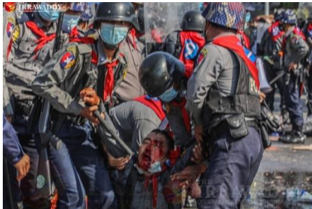
၂၀၂၁ ခုနှစ် စစ်အာဏာသိမ်းမှုကို ဆန့်ကျင်နေသည့် မဲဆန္ဒရှင် ပြည်သူများ

မြန်မာစစ်တပ်သည် ၂၀၁၅ အထွေထွေ ရွေးကောက်ပွဲရလဒ်ကို လက်ခံခဲ့ပြီး NLD ပါတီအား အစိုးရဖွဲ့ခွင့်ပေးကာ ၅ နှစ်သက်တမ်း အုပ်ချုပ်စေခဲ့သည်။ လူထု၏ ဆန္ဒကို လက်မခံဘဲ စစ်တပ်က မြန်မာနိုင်ငံရေးတွင် ဝင်ရောက်ခြယ်လှယ်မှုကြောင့် မြန်မာနိုင်ငံ၏ စီးပွားရေး၊ ပညာရေးနှင့် ကျန်းမာရေးစသည့် ကဏ္ဍအရပ်ရပ်တွင် ဆုတ်ယုတ်ကျဆင်းခဲ့ရကြောင်း ဦးဘိုဘိုဦးက ပြောသည်။