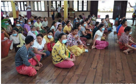
စာတိုက် - အခြေအနေရပ်နေသူများ ပရဟိတအဖွဲ့ ကျောက်မဲ

သတင်းနှင့် မီဒီယာ ကွန်ရက်။ ၂၀၂၂ ခုနှစ်၊ နိုဝင်ဘာလ ၉ ရက်။