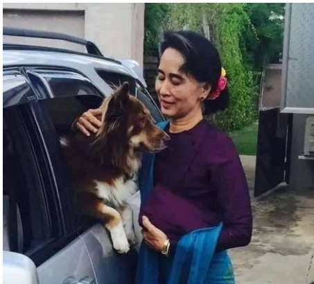
Undated picture of Taichito and Daw Aung San Suu Kyi