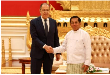
စစ်ကောင်စီခေါင်းဆောင် မင်းအောင်လှိုင်နှင့် မစ္စတာ ဆာဂေးလက်ဗရော့ပ်တို့ သံတမန်ခန်းမတွင် ၂၀၂၂ ခုနှစ်၊ ဩဂုတ်လ ၃ ရက်တွင် တွေ့ဆုံစဉ်

ကုလသမဂ္ဂက ဦးကျော်မိုးထွန်းကို ဆက်လက် အသိအမှတ်ပြုပြီး စစ်ကောင်စီ၏ ကိုယ်စားလှယ်ကို လက်မခံသောကြောင့်လည်း စစ်ကောင်စီသည် ဒေါသထွက်နေသည်။ လက်စားချေသည့်အနေဖြင့် စစ်ကောင်စီသည် မြန်မာရှိ ရုရှနာ ဘာဂနာ၏ ရုံးခန်းကိုလည်း ပိတ်ပစ်ခဲ့သည်။