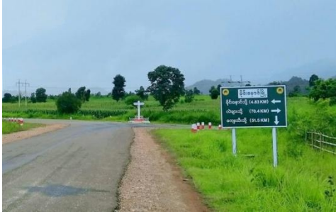
မိုင်းနောင် - ကျေးသီး

“ကျေးသီးနဲ့ မိုင်းနောင်ကြားက လမ်းဘေးတစ်နေရာမှာ စစ်ကောင်စီ တပ်ဖွဲ့က စစ်ကားနဲ့ ထိုင်ခုံနဲ့ လာစောင့်ပါတယ်။ စစ်သားအင်အားတွေ သိပ် မများဘူး။ ဘယ်ကလာလဲ ဘယ်ကိုသွားမလဲဆိုတာပဲမေးပြီး လက်ဘက်ရည်ဖိုးဆိုပြီး ကျနော် ပိုက်ဆံ ၂၀၀၀ ကျပ် ပေးလိုက်ရတယ်။ အဲလမ်းမှာ အမြဲတမ်းလာစောင့်နေတာတွေမဟုတ်ဘူး” ဟု ၎င်းအမျိုးသားက ပြောသည်။