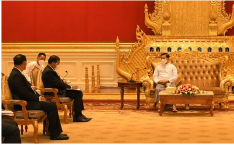
စစ်ကောင်စီခေါင်းဆောင် မင်းအောင်လှိုင်က ASEAN အထူးသံတမန် မစ္စတာ ပရက်ဆိုဒွန်းကို သံတမန်ခန်းမတွင် ၂၀၂၂ ခုနှစ်၊ မတ်လက တွေ့ဆုံစဉ်

သို့သော် မစ္စ ဟေဇာအတွက် ဝမ်းနည်းစရာကောင်းသည်မှာ မင်းအောင်လှိုင်သည် ကုလသမဂ္ဂကို မထေမဲ့မြင်ပြုရန်သာ စိတ်အားထက်သန်နေခြင်း ဖြစ်သည်။ စစ်ကောင်စီ မီဒီယာများက ထိုအစည်းအဝေးကို