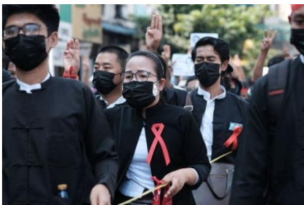
Lawyers join an anti-coup demonstration in Yangon on February 8, 2021

"Lawyers are often threatened in front of judges and are actually arrested in courtrooms for asking witnesses questions about torture and ill-treatment their clients have experienced or for requesting fair trials," the report said.