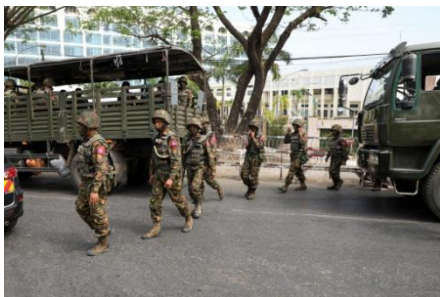
Soldiers at a protest in Yangon on February 15, 2021

Residents of an Ayeyarwady Region township are being forced to choose between joining the military or paying an onerous fine, with the large cash payments seemingly being used to lure more young people into joining up.