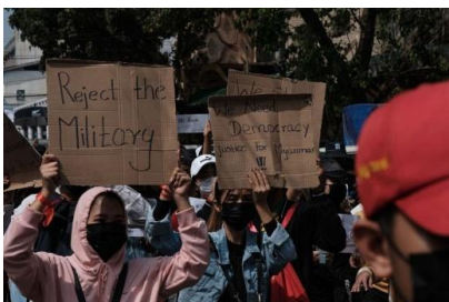
An anti-coup protest is seen in Yangon on February 8, 2021

But as bad as Myanmar’s ordinary courts have become, they are still not as arbitrary or oppressive as the military tribunals that handle cases in areas that have been placed under martial law.