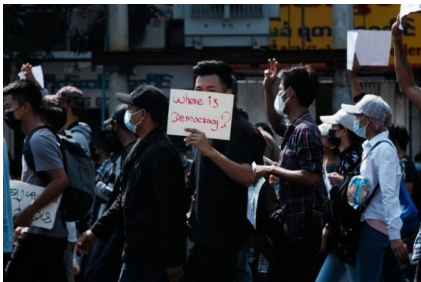
An anti-coup protest is seen in Yangon on February 8, 2021