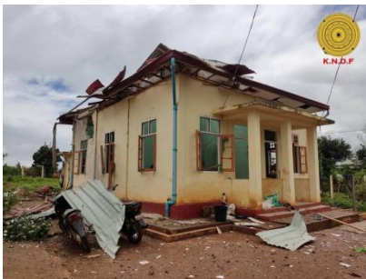
The clinic in Daw Par Pa village, Loikaw township, Kayah State, which was destroyed in a junta air raid on August 9.

A PKPF official told RFA the junta has suffered major casualties and has no public support so it is replenishing its forces to try to control Kayah State.