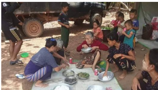
Refugees in Kayin state's Bilin township, May 5, 2022.

“There are more than 600,000 IDPs [since the coup] and we are trying to find ways to prevent any further increase in that number,” he said.