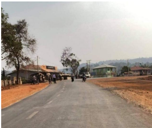
Check point at 4 mile Taunggyi capital of Shan State

It told 33 villages in Hseng Lae village tract, Hsihseng Township, to compile a list of able-bodied persons and for each village to pay the PMF $16 and a basket of rice. An anonymous source from Hseng Lae told SHAN that village leaders have until 16 June to submit a list, fearing that Pa'O soldiers will otherwise abduct youths from their homes. The man learned that new recruits are expected to complete at least nine days of military training.