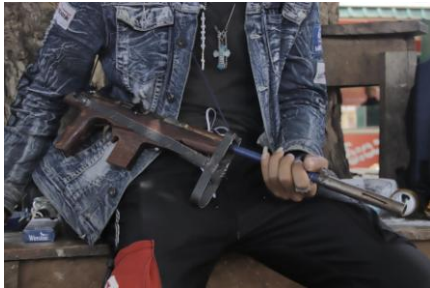
A PDF fighter in Kayah State's Demoso Township holds a handmade rifle

As Myanmar's struggle to end military rule turns into a war of attrition, some in the armed resistance movement are beginning to wonder how much longer they can last.