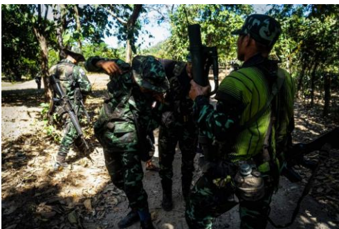
KNLA troops pictured in April (KNU)

The Karen National Union (KNU) is anticipating further battles in Karen State’s Myawaddy Township—which borders Thailand—after a large column of troops from the military-backed Border Guard Force (BGF) reportedly entered the region in recent days.