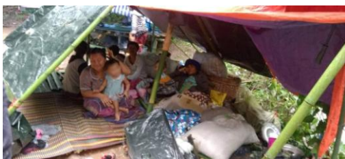
မြဝတီခရိုင်၊ လေးကေကော်၊ ဖလူးနှင့် သေ့ဘော့ဘိုးဒေသရှိ စစ်ဘေးရှောင်များ နေထိုင်သည့်နေရာတွင် ရေကြီးမှု များ ဖြစ်ပေါ်နေစဉ်

ထို့ပြင် ယခုကဲ့သို့ လုပ်ဆောင်မှုသည် အာဆီယံဘုံသဘောတူညီချက် (၅) ချက်မှ အချက်တချက်ကို ဆောင်ရွက်ရန် အားပေးမြှင့်တင်ခြင်း မဟုတ်ဘဲ ရက်စက်ကြမ်းကြုတ်သည့် ရာဇဝတ်မှုများကို ကျူးလွန်နေသည့် စစ်ကောင်စီ၏ လုပ်ရပ်များ လက်ရဲဇက်ရဲ ထပ်မံကျူးလွန်လာစေရန် အားပေးခြင်းသာ ဖြစ်ကြောင်းလည်း ဆိုထားသည်။