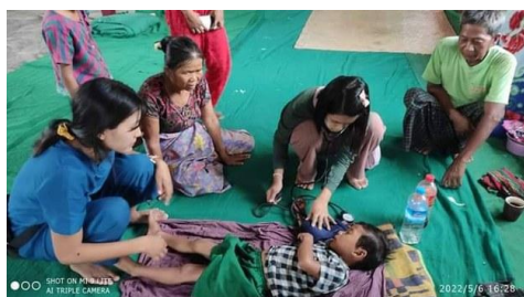
A child refugee suffering from diarrhea in Sagaing region's Southern Kalembo township, May 6, 2022.Nationwide hardships for IDPs

“Humanitarian partners will be forced to cut back on their support at a time when this assistance is needed the most, particularly as the monsoon season is just getting underway.”