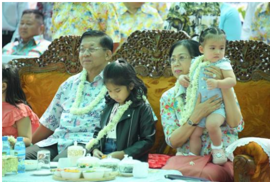
Min Aung Hlaing, his wife Kyu Kyu Hla and their grandchildren celebrate the Thingyan water festival in April 2022.

Before the army office was relocated from Yangon to Naypyitaw, the land on which the Lotte Hotel now stands was home to the Sin Phyu Shin Housing facility, where military officers of the rank of lieutenant colonel and above lived. A number of high-ranking military officers also had residences along the lane, and these were left vacant after the military office was moved to Naypyitaw.