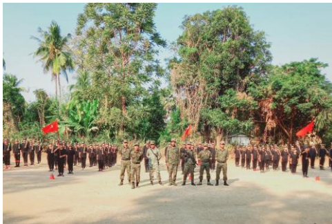
Recent recruits to an armed resistance group in Sagaing Region attend a basic-training graduation ceremony in February

An AK-47 assault rifle that cost around 2m kyat (just over $1,000) a year ago now sells for four times that amount, according to sources familiar with the situation. In some areas, such as Yinmabin Township in southern Sagaing Region, the same guns can fetch as much as 12m kyat, the sources said.