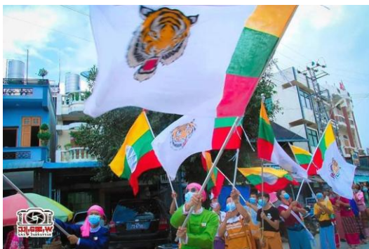
An SNLD rally in Namkham, Shan State, on October 7, 2020