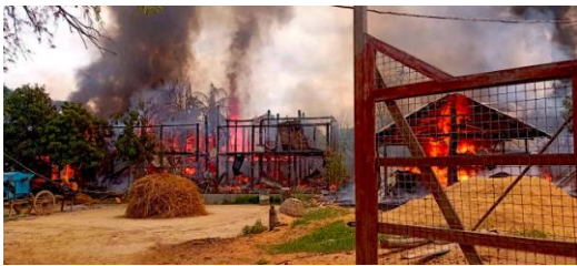
မြောင်မြို့နယ်အတွင်း မီးရှို့ခံရသည့် နေအိမ်နှင့် ဘုန်းကြီးကျောင်းများ