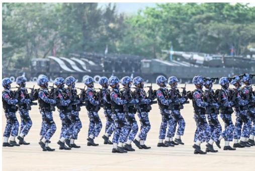
Armed Forces Day in Naypyitaw in March.

A Myanmar air force lieutenant colonel who received military training in Japan is deployed with forces that have been implicated in serious abuses in Myanmar's central Magway Region, Human Rights Watch and Justice For Myanmar said today.