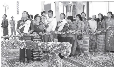
ထီးတော်တင်ပွဲတခုတွင် တွေ့ရသည့် ဗိုလ်ချုပ်မှူးကြီး သန်းရွှေနှင့် ဆွေမျိုးတစု

လက်ရှိအာဏာသိမ်းစစ်ခေါင်းဆောင် မင်းအောင်လှိုင်ကတော့ သူ့ရှေ့က ဦးနေဝင်း၊ ဦးသန်းရွှေအစရှိတဲ့ အာဏာရှင်တွေရဲ့ ပြည်သူကို ဖိနှိပ်သတ်ဖြတ်၊ တိုင်းပြည်ဘဏ္ဍာကို ခိုးဝှက်၊ သာသနာဒါယကာဘွဲ့ခံယူ စတဲ့ အစဉ်အလာကို အချိန်တိုအတွင်း အပြည့်အဝ ခံယူကျင့်သုံးခဲ့ပေမယ့် ပြည်တွင်းနဲ့ နိုင်ငံတကာရဲ့အသိအမှတ်ပြုထောက်ခံမှုကို အခုထိ မရသေးသလို အုပ်ချုပ်မှုယန္တရားကလည်း အပြည့်အဝ မလည်ပတ်နိုင်သေးပါဘူး။