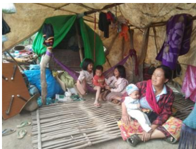
IDPs at Moebye 2

A group of people are holding and carrying bags while struggling to walk on a two foot wide track in a deep forest.