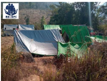
IDPs at Moebye 1

Currently, there are almost no supporters to provide food and supplies. Moreover, there is neither mobile phone signal nor internet connection in that IDPs camp area.