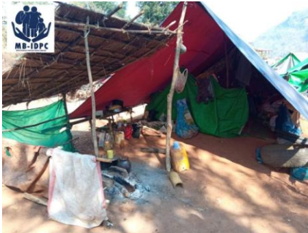
IDPs at Moebye 3

“Many children are at the IDPs camp – they are at almost every camp. Some of them are 6 to 8 years old and they still do not have a chance to study yet. Some are 7 years old and they have never been to kindergarten yet. So, if we look at education, it is getting worse and worse,” U Yan disappointedly told SHAN.