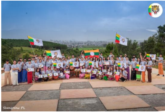
An SNLD campaign event in Panglong, Shan State, on October 23, 2020

The conference follows a February threat by the military council to suspend the prominent ethnic political party's activities for three years for their failure to follow budgetary guidelines issued by the junta-controlled Union Election Commission (UEC).