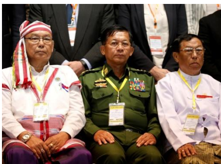
Myanmar's Commander in-Chief Senior General Min Aung Hlaing (C) poses for a photo during the second anniversary of the Nationwide Ceasefire Agreement (NCA) in Naypyidaw, in a file photo.

In addition to the KIA, KNU, KNPP, and CNF, the other ethnic armies to reject the invitation were the All Burma Students Democratic Front and the Lahu Democratic Union — two of the 10 groups that have signed a Nationwide Ceasefire Agreement (NCA) with the government since 2015.