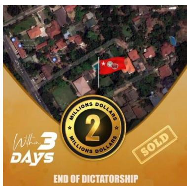
Min Aung Hlaing's Inya Lake Residence.