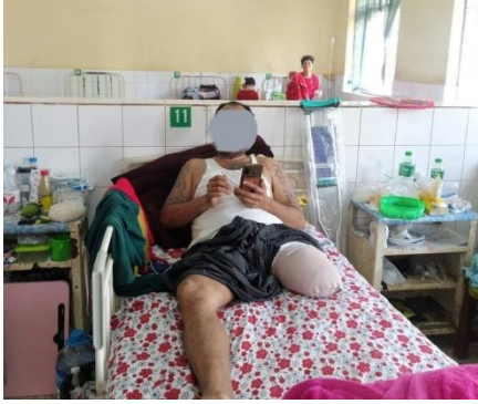
နေထိုင်ကြောင်း သိရသည်။

“သူက ဖြစ်တာတော့ကြာပြီ၊ ဖေဖော်ဝါရီလအတွင်းမှာ နင်းမိတာ။ ပြီးတော့ သူ့ခြေထောက်တစ်ဖက်ကို ဖြတ်လိုက်ရတယ်။ စဖြစ်တုန်းကတော့ သူ့အတွက် စားဝတ်နေရေးက အဆင်ပြေနေသေးတယ်။ အခုကသူ့အလုပ်မလုပ်နိုင်တော့ဘူး” ဟု သီပေါမြို့ ဒေသခံ အမျိုးသားတစ်ဦးက ပြောသည်။