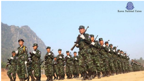
Karen National Union soldiers in an undated photo.

Reported by RFA Myanmar Service | 2022.05.09