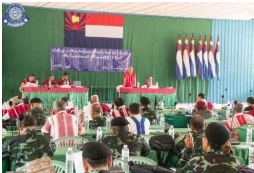
The sixth meeting of the KNU's Central Standing Committee in progress on November 8, 2018.

The Karen National Union issued a statement on May 9 saying that it would not be able to attend the peace talk invited by Chairman of the State Administration Council Senior General Min Aung Hlaing as it is not favourable for an inclusive dialogue.