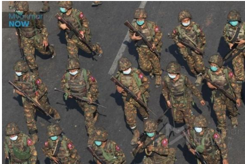
Junta forces seen in Yangon in March 2021

A military raid on a base used by local anti-junta defence forces in Mandalay Region's Madaya Township on Wednesday led to an estimated 11 casualties on the junta's side and the subsequent arrest of five members of the resistance, one of the fighters said.