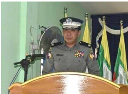
ရဲချုပ် အောင်ဝင်းဦး

သို့သော် ဒုရဲချုပ် အောင်ဝင်းဦးသည် မြန်မာနိုင်ငံရဲတပ်ဖွဲ့တွင် CID တပ်ဖွဲ့တွင်သာ တာဝန်ထမ်းဆောင်ပြီး အချိန်တိုအတွင်း ဒုရဲချုပ် ဖြစ်လာခဲ့သူဖြစ်သည်။