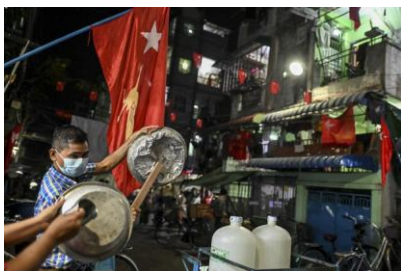
Anti-coup protesters march in Yangon, Feb. 5, 2021.

An announced plan to auction off the homes of anti-coup activists is the military regime’s bid for revenge after Myanmar’s shadow government began selling shares of assets appropriated by Snr. Gen. Min Aung Hlaing and other junta officials, according to analysts.