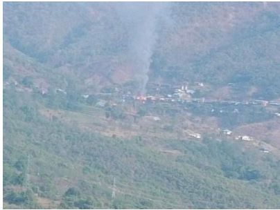
Houses from Tlangzar village in Falam, Chin State are seen burning on May 5

Myanmar army troops have also perpetrated similar recent attacks on villages in neighbouring Chin State, which, like Sagaing, has been a stronghold of resistance forces.