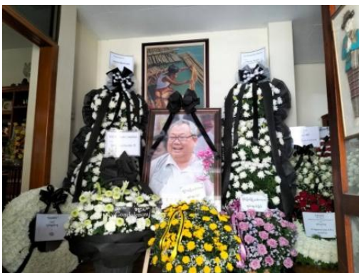
ခွန်ထွန်းဦး ဈာပနာ

သျှမ်းနိုင်ငံရေးခေါင်ဆောင် ရှမ်းတိုင်းရင်းသားများ ဒီမိုကရေစီအဖွဲ့ချုပ် SNLD တည်ထောင်သူ နှင့် ဥက္ကဋ္ဌဟောင်း ခွန်ထွန်းဦးဟာ ပြီးခဲ့တဲ့ ဧပြီ (၃၀) ရက်က ရန်ကုန်နေအိမ်မှာ ကွန်လွန်သွားခဲ့ပါတယ်။ မေလ (၂) ရက်က ခွန်ထွန်းဦးရဲ့ ရုပ်အလောင်းကို ရန်ကုန်မြို့မှာ သင်္ဂြိုဟ်ပြီး ကျန်ရှိနေတဲ့ အရိုးပြာကိုတော့ သျှမ်းပြည်မြောက်ပိုင်း သီပေါမြို့နယ် စော်ဘွားကြီး သချိုင်းမှာ ဂူသွင်းသွားမှာ ဖြစ်ပါတယ်။ သူသေဆုံးသွားပြီးတဲ့နောက် တိုင်းရင်းသားတွေနဲ့