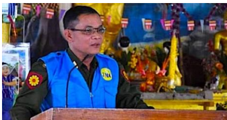
ရဲချုပ် သန်းလှိုင်

ထို့နောက် အာဏာသိမ်း စစ်ခေါင်းဆောင်သည် သူယုံကြည်ရသူ ဒုတိယ ဗိုလ်ချုပ်ကြီး သန်းလှိုင်ကို ရဲချုပ်အဖြစ် ခန့်အပ်ခဲ့သည်။ ရဲချုပ်ဖြစ်လာသူ သန်းလှိုင်သည် စစ်အာဏာသိမ်းမှုကို ဆန့်ကျင်သော ငြိမ်းချမ်းစွာ ဆန္ဒပြသူများအား အကြမ်းဖက် ဖြိုခွဲခဲ့သည်။ အချို့သောဆန္ဒပြပွဲများအား ရဲတပ်ဖွဲ့မှ ဖြိုခွဲရာတွင် သူကိုယ်တိုင် မြေပြင်အထိဆင်းကာ ကြီးကြပ်ခဲ့သည်။