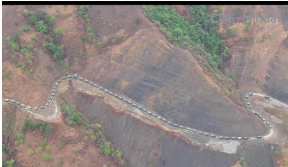
Aerial view of the junta convoy travelling on the Mindat-Matupi Road.

One CDF-Mindat member died in an accidental mine explosion after the ambush.