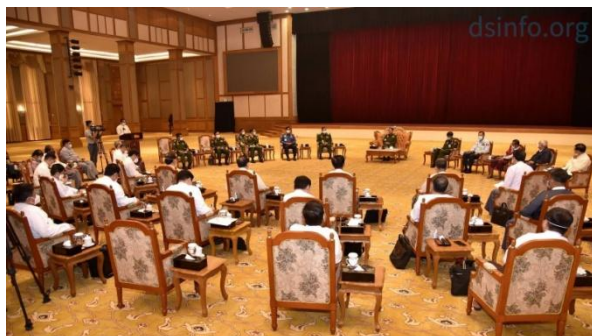
Coup leader Min Aung Hlaing meets with leading business people on February 4, 2021, days after seizing power

“Maybe the military is afraid of the cronies taking the side of the enemy. They could be doing this just to prevent that from happening,” he said.