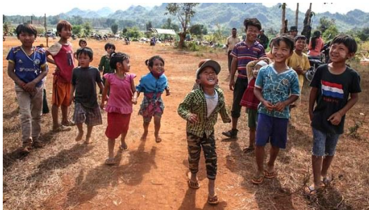
Children at a refugee camp in Kayah state, December 2021.

Children whose families have fled fighting in Myanmar's conflict zones are being deprived of essential immunizations due to lack of access to health care, refugees and medical professionals said Thursday.