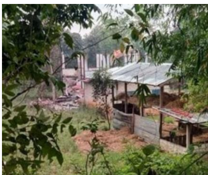
Myanmar Military Torched a Civilian House in Ywarngan Township

On 18 April 2022, Myanmar military soldiers burned a plain civilian house around 8 P.M at Na Ban Kyi village, Ywarngan township, Southern Shan State.