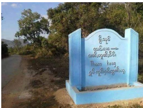
Tong Keng village Tong Lao Mong Kung

It is reported that two men from Tong Keng village, Tong Lao tract, Mongkung township, Southern Shan State, stepped on a landmine while they were hunting, and one of them was killed.