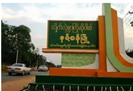
Namzang Township.

According to the Shan Human Rights Foundation, over 100 villagers were forced by junta troops to build a new military outpost about one mile from a large new coal mining operation, planned by a subsidiary of the Mandalay-based Ngwe Yi Pale company, in southern Shan State.