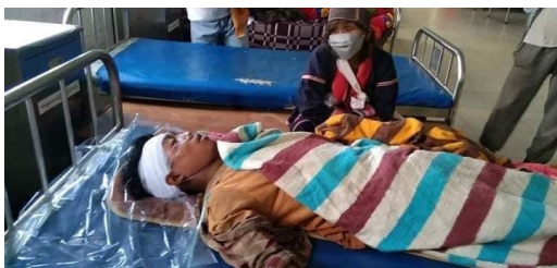
Mong Kung man stepping landmine

There are some unreachable areas where the locals are affected by the landmines but the data could not be collected.