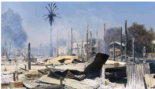
Houses destroyed by fire in Letpan Hla village, in Magway region's Pauk township, March 3, 2022.

Sources in Magway's Gangaw township told RFA's Myanmar Service that 10 deaths occurred from Feb. 28 to March 2 as troops raided the villages of Thindaw, Shwebo, Kone and Sann.