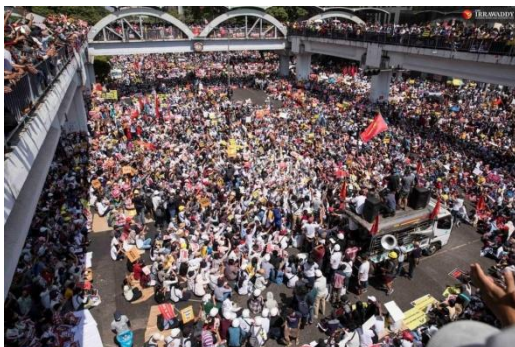
Yangon in February last year protests after the military coup.

It is mainly because the international community regards the crisis as a domestic issue if we compare it with the Ukraine war. It is widely believed that countries should not interfere in domestic affairs.