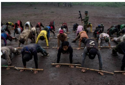
People's defense force volunteers train in Demoso Township, Kayah State, in October last year.

Our ministry meets representatives from foreign countries to discuss opportunities for defectors to seek asylum. Some countries are granting asylum although they have not announced it publicly.