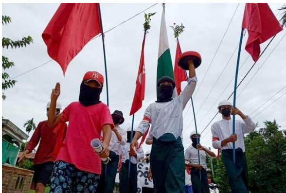
Protesters take part in an anti-coup rally in Dawei in June 2021

Wathone Nyein Aye | Published on Apr 1, 2022