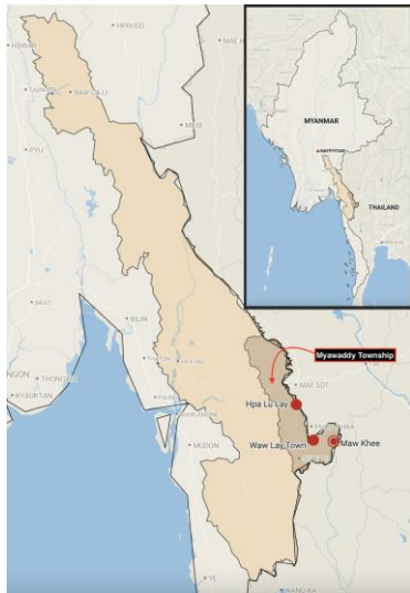
Map showing the location of the Maw Khee base on the Myanmar-Thai border