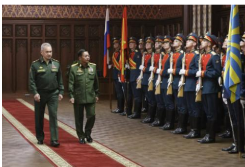
Coup leader Min Aung Hlaing meets with Russian Defense Minister Sergei Shoigu in Moscow last year.

In a screenshot shared online in Myanmar shortly after the Russian invasion, a Ukrainian man is doing an interview with ABC news. Asked about being separated from his family as he prepared to defend the country, he says, “Everything will be okay.”