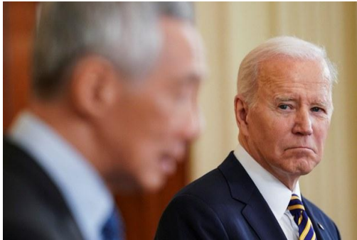
U.S. President Joe Biden listens during a joint news conference with Singapore's Prime Minister Lee Hsien Loong in the East Room at the White House in Washington, DC, March 29, 2022.