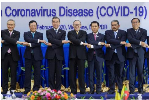
A file photo showing ASEAN foreign ministers posing with China's Foreign Minister Wang Yi at a meeting in Vientiane, Laos, about the COVID-19 pandemic, Feb. 20, 2020.

"We believe the clock is ticking, and we want to try and get this done. And we're working very closely with ASEAN to try and come up with an appropriate time to do this," said the official who was briefing reporters on condition of anonymity, under ground rules set by the administration.