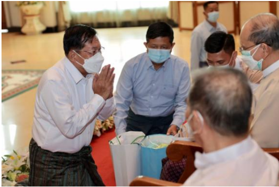
Coup leader Min Aung Hlaing pays respect to ex-president U Thein Sein on Sunday.

His appearance at the ceremony hosted by Min Aung Hlaing on Sunday proved that the former general was not a genuinely reform-minded president when he was internationally praised for the democratization process in Myanmar during his presidency from 2011 to early 2016.