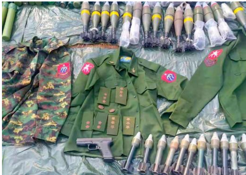
ဒီဇင်ဘာ ၁၉ ရက်နေ့က တိုက်ပွဲတွင် ကိုးကန့်အဖွဲ့က သိမ်းနိုင်ခဲ့သည့် တပ်မ ၇၇ တပ်မှ ယူနီဖောင်းနှင့် လက်နက်ခဲယမ်းများ / The Koekang

ဒါပေမယ့် အခုနောက်ပိုင်းတော့ မတရား အာဏာသိမ်းမှုကို မလိုလားတဲ့ တော်လှန်ရေးတပ်ဖွဲ့တွေဟာ နိုင်ငံအနှံ့ ပေါ်ပေါက်လာတဲ့အတွက် တပ်အပြင်ထွက်လိုက်တာနဲ့ စစ်ဆင်ရေးနယ်မြေသဖွယ် ဖြစ်လာခဲ့ပါတယ်။ ဒါကြောင့် အာဏာသိမ်းကာလနောက်ပိုင်း စစ်တပ်ရဲ့ ပြုန်းတီးမှုထဲမှာ စစ်ဆင်ရေးကြောင့် ပြုန်းတီးမှုဟာလည်း တခုအပါအဝင် ဖြစ်လာပါတယ်။