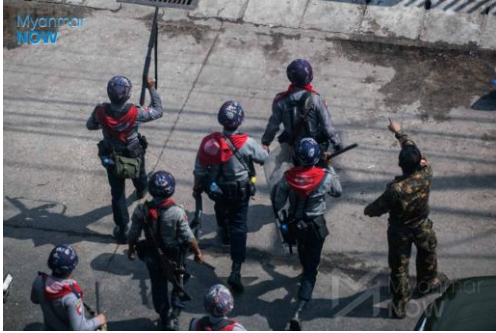
Junta soldiers during a crackdown on a protest in Yangon on March 3, 2021

One of the five objectives outlined in the 22-page Police Force Law, signed by junta chief Min Aung Hlaing on March 25, is for law enforcement personnel to “take part in the state’s defence and security affairs when necessary.”