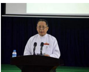
UEC Chairman U Khin Maung Oo

The Shan Nationalities League for Democracy (SNLD) defied a formal order from the military junta-appointed Union Election Commission (UEC) inviting it to its office for an audit.