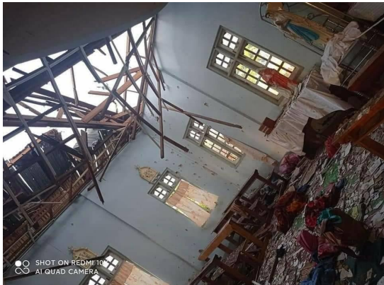
The Sacred Heart Church in Kayah State's capital Loikaw is seen in May 2021 after being destroyed by junta shelling that killed four people.

against Karenni and Chin resistance fighters, during which the regime has resorted to using airstrikes and heavy weapons including artillery.