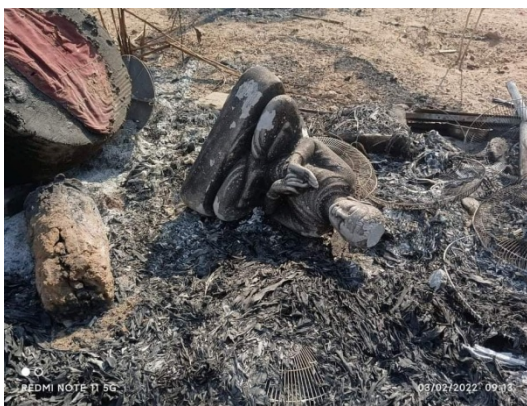
A burned Buddha statue is seen in Thapyayaye Village, Yinmabin Townnship, Sagaing Region.

The same township suffered the regime's brutality in late February when soldiers raided Chin Phone Village's monastery and detained over 80 primary schoolchildren as human shields for 36 hours.