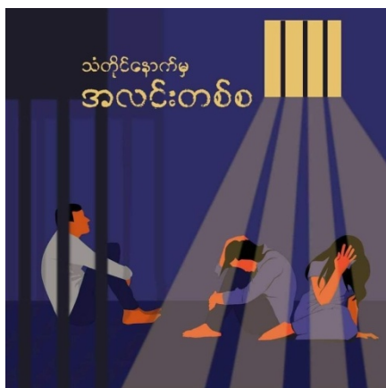
Light Behind Bars campaign poster.