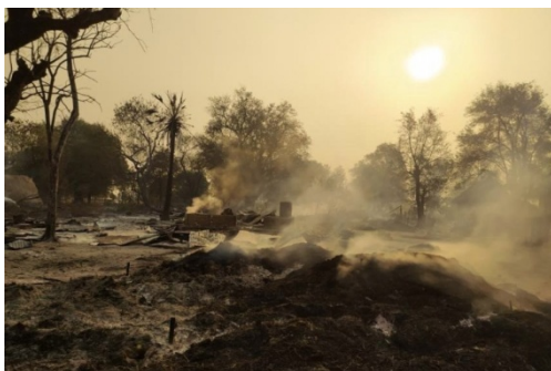
Tamoke village in Sagaing’s Khin-U township on the morning of March 16 after a military raid

Sa Thant Zin | Published on Mar 27, 2022