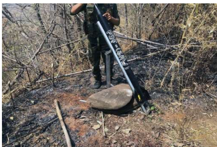
A Saw PDF member prepares to fire a handmade mortar

Clashes have been breaking out almost daily between anti-junta defence forces and the Myanmar army for nearly a week in Saw and Kyaukhtu townships in Magway Region, members of the resistance said.