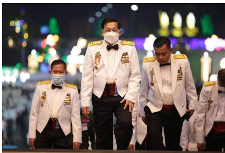
Regime leader Min Aung Hlaing and his generals at a dinner marking Armed Forces Day in Naypyitaw on Sunday.

Since the coup in February last year, thousands of soldiers, including some battalion commanders, have left the military, amid growing armed resistance.