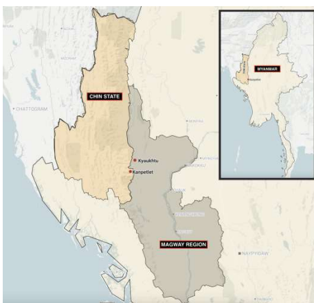
Chin State and Magway Region as seen on the map

The guerrilla fighters used handmade mortar shells and explosive devices, according to an information officer from the Saw People’s Defence Force (PDF), who claimed that five junta soldiers were killed in the incident.