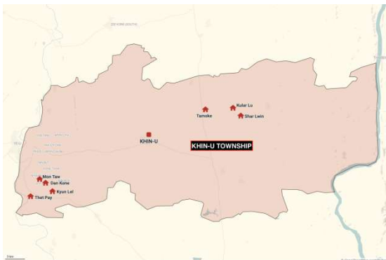
Villages in Khin-U Township that were torched between March 5 and March 16

"I just think this is very inhumane," the Shar Lwin resident said. "They don't even know how much those houses cost. It pains us deeply as we had to build those houses with our hard-earned money. It angers us a lot too."