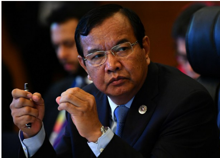
အာဆီယံအထူးကိုယ်စားလှယ် Prak Sokhonn

မြန်မာနိုင်ငံဆိုင်ရာ အာဆီယံအထူးကိုယ်စားလှယ် Prak Sokhonn ရဲ့ ခရီးစဉ်အတွင်း ဖမ်းဆီးခံထားရတဲ့ နိုင်ငံတော်အတိုင်ပင်ခံပုဂ္ဂိုလ် ဒေါ်အောင်ဆန်းစုကြည်နဲ့ သမ္မတဦးဝင်းမြင့်တို့ကို တွေ့ဆုံဖို့ အမျိုးသား ညီညွတ်ရေးအစိုးရ NUG က မတ်လ ၂၁ ရက် ဒီကနေ့ ကြေညာချက် ထုတ်ပြန်တောင်းဆို လိုက်ပါတယ်။