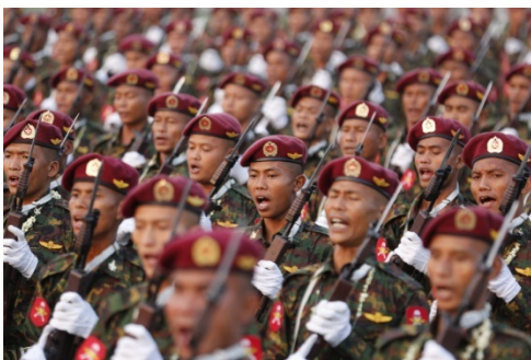
Soldiers march during Armed Forces Day celebrations in Naypyitaw on March 27, 2018

Three lieutenant colonels serving as battalion commanders for the Myanmar military have defected and surrendered to the Karen National Union (KNU), making them the highest ranking soldiers to do so since last year's coup.