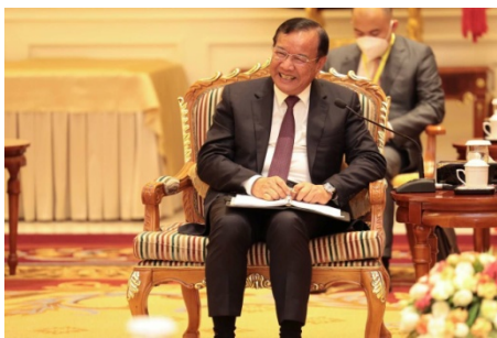
၂၀၂၂ ခုနှစ် မတ်လ ၂၁ ရက်နေ့က မြန်မာနိုင်ငံသို့ ရောက်ရှိလာသည့် အာဆီယံအထူးကိုယ်စားလှယ် Prak Sokhonn ကို နေပြည်တော်တွင် တွေ့ရစဉ်။

“ငြိမ်းချမ်းရေးဆောင်ရွက်မှု ညှိနှိုင်းရေးကော်မတီနဲ့တွေ့ဖို့ ရှိတယ်။ ပြီးရင် EAO တွေနဲ့ တွေ့ပေးဖို့ ရှိပါတယ်။ တချို့ တွေ့ချင်နေတဲ့ နိုင်ငံရေးပါတီတွေနဲ့ တွေ့ပေးဖို့ရှိပါတယ်။ နိုင်ငံတော်ဝန်ကြီး ချုပ်နဲ့ တွေ့ဖို့ အစီအစဉ်ရှိတယ်။ သက်ဆိုင်ရာဝန်ကြီးဌာနတွေနဲ့ တွေ့ဖို့ရှိပါတယ်။ အကြမ်းဖက် အဖွဲ့အဖြစ် ကြေညာထားတဲ့ သူတွေနဲ့တော့ ဘယ်အစိုးရမှ တွေ့ဆုံ မပေးပါဘူး။ ကျနော်တို့ မြန်မာနိုင်ငံအစိုးရ တစ်ရပ်တည်းမှ မဟုတ်ပါဘူး”