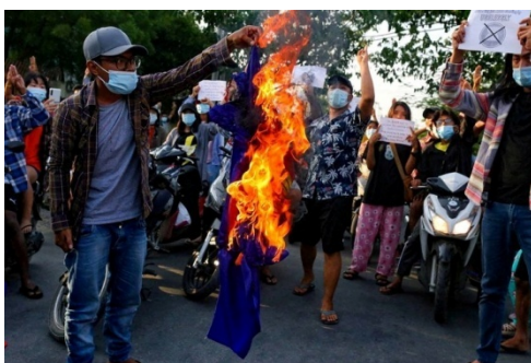
Protesters against Myanmar's junta burn the flag of the Association of Southeast Asian Nations (ASEAN), in Mandalay, June 5, 2021.

“The ASEAN chairmanship seems to be showing a bit of favor to the junta in Naypyidaw,” he said. “Not meeting with the NLD, and instead meeting with someone only the junta agrees to — these are just acts of bullying that they are doing to the people in the current situation. It’s nothing surprising.”