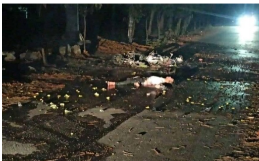
A body of a guerrilla fighter is seen near a motorcycle after accidental explosion on Tuesday night (CJ)

"I personally saw the dismembered limbs scattered all over the road," said another witness.