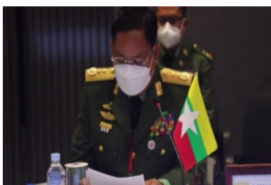
Lt-Gen Moe Myint Tun attended the 12th ASEAN Military Operation Meeting.

A Myanmar delegation led by the junta’s Chief of Military Security Affairs Lt-Gen Ye Win Oo attended the 19th ASEAN Military Intelligence Meeting-AMIM-19 in Phnom Penh, Cambodia on 15 March, according to the junta aligned