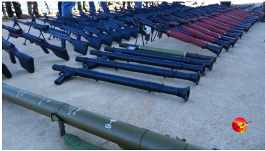
Weapons seized from the Ta'ang National Liberation Army in November 2019.