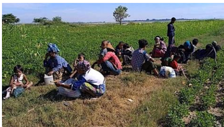
မတ္တရာမြို့နယ်အတွင်းက စစ်ဘေးရှောင်များ / C/

၎င်းက “မနေ့က နေ့လယ်ပိုင်းကစပြီး ဧရာဝတီမြစ်ထဲကနေ စက်လှေတွေ၊ မော်တော်တွေနဲ့ မြစ်ရိုးကျေးရွာတွေကို ဝင်စီးပြီး လုယက်တာတွေ လုပ်ခဲ့ကြတာ။ ဒီနေ့ မနက်ပိုင်းမှာလည်း ရွာစဉ်ဆက်ပြီး လက်နက်ကြီးတွေနဲ့ထုပြီး ဝင်စီးတာတွေ လုပ်တယ်။ နောက်ပြီး အဖမ်းခံရတဲ့သူတွေကလည်း ဘာမှ အပြစ်ရှိတဲ့သူတွေ မဟုတ်ဘူး။ အချို့ဆိုရင် နွားကျောင်းနေရင်းနဲ့ကို အဖမ်းခံလိုက်ရတာ။ လူသားခိုင်းအဖြစ် အသုံးပြုဖို့ ဓားစာခံအနေနဲ့ ဖမ်းခေါ်သွားတာမျိုးပေါ့။ သူတို့ သွားတဲ့လမ်းကြောင်း အတိုင်း လမ်းပြခိုင်းတယ်လို့ သိရတယ်” ဟု ရှင်းပြသည်။