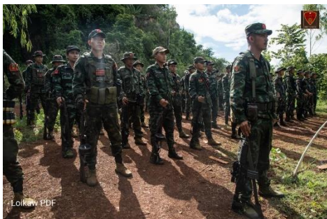
လွိုင်ကော် PDF တပ်သားသစ် လူငယ်များ လေ့ကျင့်ရေးဆင်းနေစဉ်

ဒေါ်အောင်ဆန်းစုကြည်သည် လူငယ်များ၏ စွန့်လွှတ်အနစ်နာခံမှုများကို သိနိုင်ပြီး သူ၏ စကားများက လူငယ်များ၏ အင်အားကို အားကိုးကြောင်း ဖော်ပြနေသည်ဟု တနင်္သာရီတိုင်း၊ လောင်းလုံမြို့နယ်မှ အသက် ၂၂ နှစ်အရွယ် ဒီမိုကရေစီ တက်ကြွလှုပ်ရှားသူတဦးက ပြောသည်။