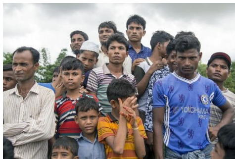
Rohingya refugees in Bangladesh in 2019

At least five people are believed to have died aboard a boat carrying some 160 Rohingya refugees from Bangladesh to Malaysia, according to family and activist sources.