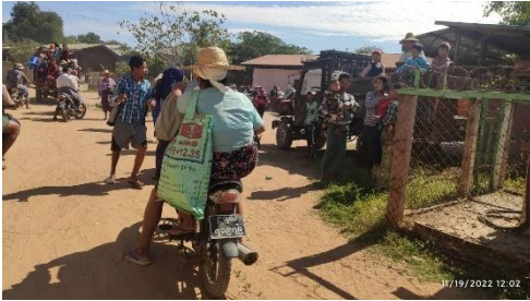
ခင်ဦးမြို့နယ်အတွင်းက စစ်ရှောင်များ (CJ)

စစ်ကိုင်းတိုင်း၊ ခင်ဦးမြို့နယ်မှ စစ်ဘေးရှောင် အမျိုးသမီးတဦးက “ခံစားရတာတော့ ပြောမနေနဲ့အေ ရူးချင်သလိုလိုကို ဖြစ်လို့တော်။ အရင်နေရာ ပြန်နေရမှာလည်း မဟုတ်ဘူး ပြန်ဖြစ်တော့မှာလည်း မဟုတ်တော့ပါဘူး။ ပြန်မကြည့်ဖြစ် ပါဘူး။ ဘာမှ မကျန်တော့တာ သစ်ပင်ရိပ်တောင် ကောင်းကောင်း မကျန်ရစ်ဘူး။ ဘုန်းကြီးကျောင်းမှာပဲ နေရသေးတာ။ ငိုလိုက်ရတာ အဲဒီနေ့က လူကို ရူးမတတ်ပါပဲအေ။ ခံစားလိုက်ရတာတော့ ပြောမနေနဲ့” ဟု ဧရာဝတီကို ပြောသည်။