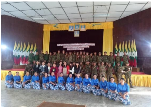
မြောက်ပိုင်းတိုင်း စစ်ဌာနချုပ်ရောက် မြန်မာ့အသံနှင့် ရုပ်မြင်သံကြား (MRTV)နှင့် နယ်လှည့် ပြည်သူ့ ဆက်ဆံရေး အဖွဲ့သားများ (CINCS)

မြောက်ပိုင်းတိုင်းစစ်ဌာနချုပ်နယ်မြေ မြစ်ကြီးနားမြို့ နှင့် ပိုင်းမော်မြို့တို့ရှိ တပ်ရင်းဌာနချုပ်များတွင် ပြုလုပ်ခဲ့သော တပ်တွင်း ဖျော်ဖြေပွဲများတွင် ဈေးရောင်းပွဲ၊ ပြဇာတ်များ၊ စစ်ချီတေး၊ စစ်သည်တေးသီချင်းများ၊ ခေတ်ပေါ်နှင့် ခေတ်ဟောင်းတေး များဖြင့် သီဆိုကပြ ဖျော်ဖြေခဲ့ကြကြောင်း စစ်ကောင်စီ၏ အာဘော်သတင်းစာတွင် ဖော်ပြထားချက်အရ သိရသည်။