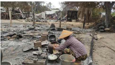
ခင်ဦးမြို့နယ်အတွင်းက မီးရှို့ခံရပြီးနောက် ရွာအတွင်း ပြန်ဝင်ကာ မိမိပိုင်ပစ္စည်းများ လာရောက်ယူဆောင်သည့် စစ်ရှောင်များ (CJ)

ခင်ဦးမြို့နယ်က ကျန် စစ်ရှောင်အမျိုးသမီးတဦးကလည်း “အကုန်လုံးက အရိပ်မဲ့သွားကြပြီလေ။ ဘာတခုမှကို မရှိတဲ့ဘဝ ရောက် သွားမှတော့ စိတ်ခံစားချက်တွေက ပြင်းတာပဲ။ ဒါပေမယ့် ကိုယ့်ကိုယ်ကိုယ် ပြန်ပြီး ဖြေနိုင်အောင် ဖြေနေရတာပဲ။ ငါတို့ ဝမ်း နည်းပြီး ရင်ကွဲပက်လက် ဖြစ်နေလည်း ဘာမှ အကျိုးမထူးတော့တာ သူတို့တွေနဲ့ နောက်တဖန် ပြန်တွေ့ရမှာ တွေလည်း ကြောက်နေလို့ အိမ်ကို သွားသာ ကြည့်ရတာ နေရာလည်း မလုပ်ရဲလို့ မလုပ်ရသေးဘူး” ဟု ပြောသည်။