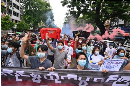
၂၀၂၁ ခုနှစ်၊ ဇူလိုင်လက ရန်ကုန်တွင် စစ်အစိုးရဆန့်ကျင်ရေး ဆန္ဒပြနေသည့် လူငယ်များ

အာဏာသိမ်းပြီးနောက် ဒေါ်အောင်ဆန်းစုကြည်ကို စစ်ကောင်စီက ဖမ်းဆီးကာ စွဲချက် တဒါဇင်ကျော်ဖြင့် စွပ်စွဲသည်။ မစ္စတာ တာနဲလ်ကို နိုင်ငံတော်အစိုးရ လျှို့ဝှက်ချက် ဥပဒေ ချိုးဖောက်မှုဖြင့် စွပ်စွဲသည်။