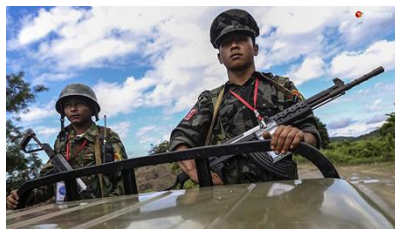
KIA troops

An intense clash broke out in Hpakant Township, Kachin State on Tuesday and Wednesday when the Kachin Independence Army (KIA) and allied PDF forces attacked regime forces stationed at a monastery in Hmawbon Village, according to