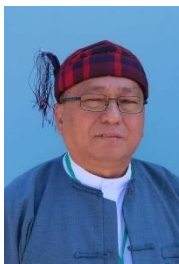
ဒေါက်တာခလမ်ဆမ်ဆွန်

ကချင်နစ်ခြင်း ခရစ်ယာန်အဖွဲ့ချုပ် (KBC) ခေါင်းဆောင် သိက္ခာတော်ရ ဆရာတော် ဒေါက်တာ ခလမ်ဆမ်ဆွန်ကို စစ်ကောင်စီမှ ဖမ်းဆီးလိုက်ခြင်းသည် စစ်ပွဲကို ဦးတည်ခြင်းဖြစ်သည် ဟု ကမ္ဘာ့ ကချင်ကွန်ဂရက် (WKC) က ထုတ်ပြန်လိုက်သည်။