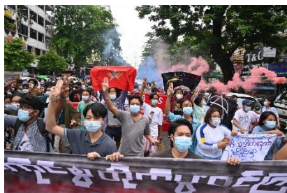
Young people join an anti-regime flashmob protest in Yangon in July 2021.

Turnell also referred to the strength of young people in his interview, saying it is easy to recognize the cleverness, spirit and ability of young Burmese people.