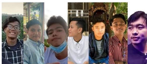
ဒဂုံတက္ကသိုလ်ကျောင်းသား (၇) ဦး သေဒဏ်ချမှတ်ခံရမှု

Parents of seven Dagon University students recently handed death sentences by the junta said that over the past week they had submitted multiple appeals and pleas for leniency to every level of the junta’s court system on behalf of the young men, but had received no response.