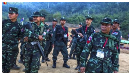
KNLA troops

Thirteen regime soldiers and two ethnic Karen resistance fighters were killed in Papun District, Karen State on Tuesday morning when the Karen National Liberation Army (KNLA) and Karen National Defense Organization (KNDO) raided the Thee Yo Htar junta outpost on a bank of the