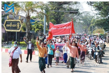
Lewe locals protest the military coup on February 12, 2021

The military council has not released any information regarding Phone Myat Ko's arrest or death.