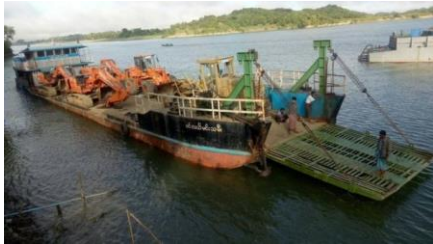
ဓာတ်ပုံ ပုံစာ, ကုလားတန်စီမံကိန်း ကုန်တင်ရေယာဉ်

စီမံကိန်းရဲ့ ရခိုင်ပြည်နယ်ဘက်ခြမ်း အစိတ်အပိုင်းတွေဟာ ၂၀၁၇ ခုနှစ်လောက်ကတည်းက ပြီးစီးနေပြီဖြစ်ပေမယ့် ဒေသတွင်းစစ်ပွဲတွေဖြစ်ပွားလာတဲ့အချိန် ၂၀၁၉ ခုနှစ်လောက်မှာတော့ စီမံကိန်းရဲ့လုပ်ငန်းအားလုံးကို ရပ်နားထားခဲ့ရတာ ဖြစ်ပါတယ်။