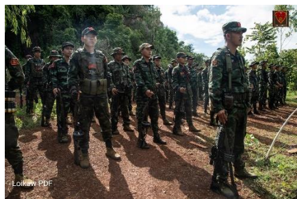
Young recruits of the Loikaw PDF undergo training.

After the military seized power, people around the country held peaceful anti-coup protests, and young "Generation Z" demonstrators took to the streets. After the peaceful protests were violently crushed, many young people picked up weapons and started to fight against the regime, joining a nationwide resistance movement that has prevented the regime from being able to take control of the country.