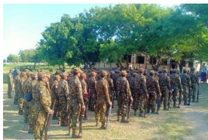
Military-armed members of the Pyu Saw Htee assemble in a village in Sagaing Region in October 2022

At least four people were killed when local defence forces attacked a gathering of Pyu Saw Htee militia members in Magway Region's Pakokku Township last week, according to resistance sources.