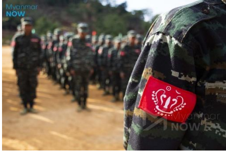
AA troops seen in Kachin State in 2017