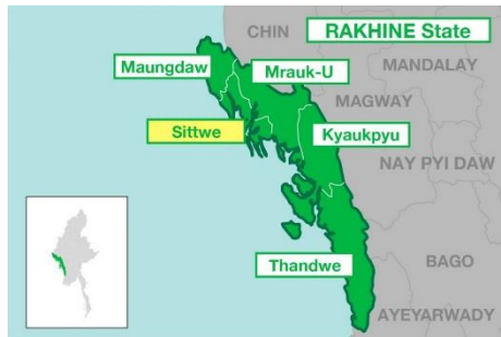
Arakan State map.

U Pe Than also said that the ceasefire has given the Military Council, which is under military pressure, a breather.