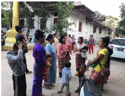
IDPs fleeing war in Hsipaw.

A local, who requested anonymity, told SHAN that five BA soldiers were killed and eight SSPP soldiers were wounded after the regime attacked Shan soldiers guarding Koong Hsar during a 30-minute battle on 25 November.