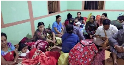
IDPs in Hsipaw township.

The Burma Army (BA) reportedly attacked the Shan State Progress Party (SSPP) as the armed group was preparing food to offer to monks at the end of a three-day Shan New Year celebration in a village in Hsipaw Township, northern Shan