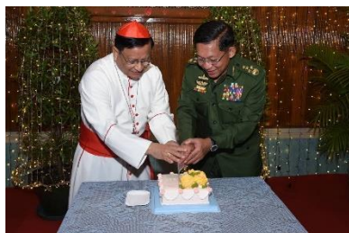
Cardinal Charles Maung Bo poses with junta chief Min Aung Hlaing in December 2021

A nine-year-old child was among at least seven people killed during a junta raid on the village of Mone Hla in northern Khin-U Township last week, according to resistance sources.