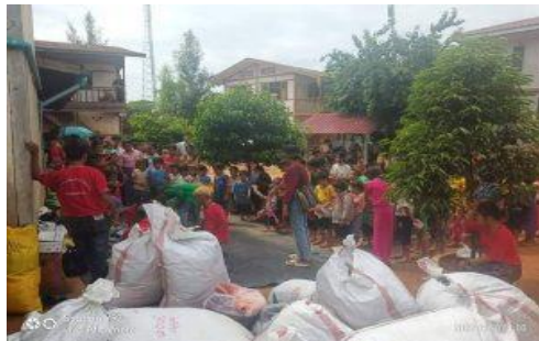
IDPs in Numtu township

The villagers stayed at the monastery for only seven days after fleeing fighting between the Burma Army and the Kachin Independence Army and the People's Defence Force.