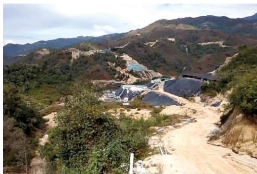
Photo shows illegal rare-earth mines in Panwa, Chibwe Township, Kachin State.

PUBLISHED 11 OCTOBER 2022 | TUN LIN AUNG (MYITKYINA)