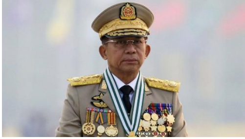
Myanmar junta leader Min Aung Hlaing

Myanmar's military is confronted with an unprecedented array of challenges. The number of military personnel has now fallen to around 200,000 from an estimated 300,000-400,000 soldiers due to growing casualties of battle-ready troops, a shortage of fresh recruits, and defections. Today, the degree to