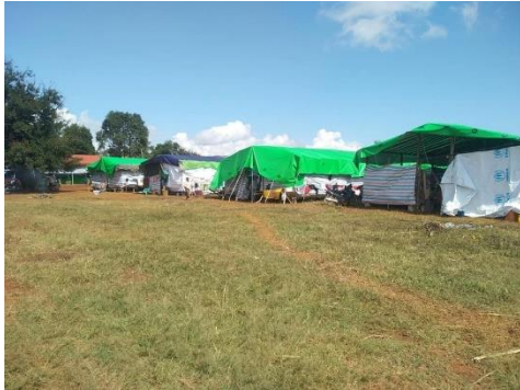
ကျောက်မဲ စစ်ရှောင်

နေရပ်ပြန်နိုင်ရန်အတွက် ဒေသတွင်း အခြေအနေစောင့်ကြည့်ပြီး အဆင်ပြေမှ နေရပ်သို့ ပြန်မည်ဖြစ်ကြောင်း ကျောက်မဲ စစ်ရှောင်ကော်မတီဝင် တစ်ဦးက သျှမ်းသံတော်ဆင့်ကို ပြောသည်။