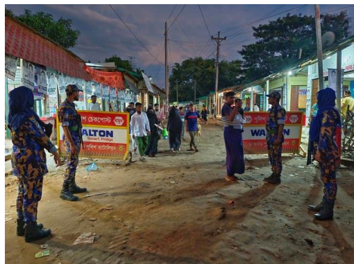
Members of Bangladesh's Armed Police Battalion patrol at the entrance of Panbazar Rohingya Camp in Ukhia, Cox's Bazar, Oct. 10, 2022. BenarNews

By Abdur Rahman and Sharif Khiam for BenarNews | 022.10.11