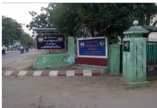
The police station in Wundwin Township, Mandalay Region.