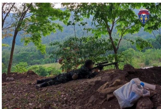
A KNLA resistance sniper during an operation in Karen State on Saturday.

Cobra Column of the Karen National Liberation Army (KNLA) claimed resistance snipers managed to kill three regime soldiers during their ambush of regime forces of Light Infantry Battalion 104 stationed on a hilltop near Taung Ni Village in Myawaddy Township, Karen State on Saturday.