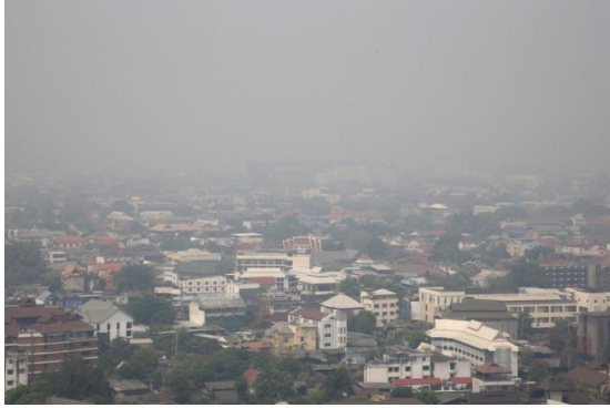
A general view of buildings in the city of Chiang Mai, northern Thailand.

The key subject areas covered were human rights, natural resource management and ethnic communities, and the constitution and democracy.