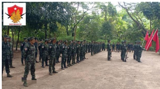
Resistance fighters of Bago Region PDF during a training session.

At 10:30 a.m. on that morning, four regime forces were killed and seven others injured when Thayarwaddy District-PDF triggered mines to attack 23 regime forces trying to raid a village in Natalin Township, Bago Region.