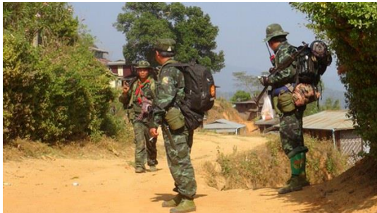
RCSS/SSA တပ်ဖွဲ့ဝင်တချို့ကို တွေ့ရစဉ်။

ရှမ်းပြည် ပြန်လည်ထူထောင်ရေးကောင်စီ/ ရှမ်းပြည်တပ်မတော် (RCSS/SSA) အနေနဲ့ ရှမ်းပြည်နယ်အတွင်းက တိုင်းရင်းသားလက်နက်ကိုင်အဖွဲ့ တွေနဲ့ ဆွေးဆုံဆွေးနွေးဖို့ ကမ်းလှမ်းတာဟာ စစ်ကောင်စီဘက်က ကြားဝင် ညှိနှိုင်းခိုင်းလို့ လုံးဝမဟုတ်ကြောင်း RCSS ပြောခွင့်ရသူက