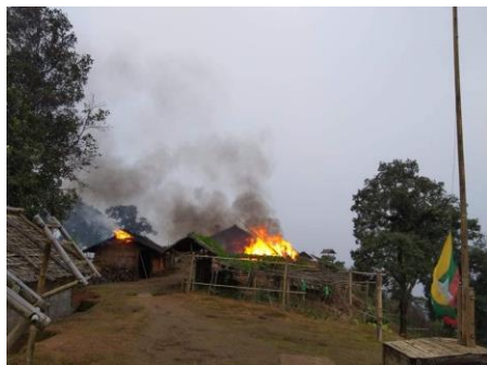
A junta outpost seized by the Karenni Army in Shadaw Township, Kayah State, in August.

Resistance groups claimed to have killed five police officers on August 21 during a drive-by shooting.