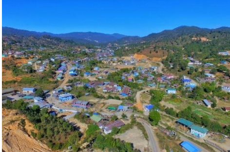
The town of Manton in northern Shan State

The fighting forced many living in the area to flee to the surrounding countryside or to northern Shan State's largest town, Lashio. Several houses and monasteries in Manton were reportedly damaged by the military's heavy artillery fire, and phone signals and the internet were also cut off in the town. Casualty figures were not available.