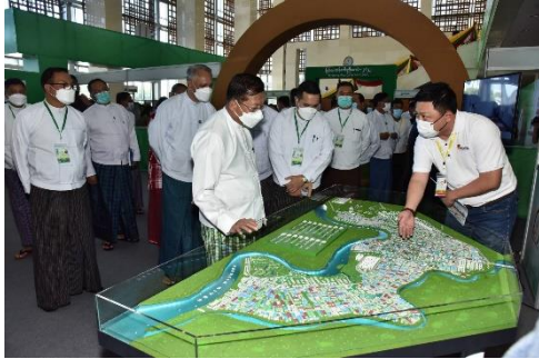
Regime leader Min Aung Hlaing at the Myanmar Rice Conference in Naypyitaw on Oct 6, 2022.

While the World Bank predicts 3 percent growth for the fiscal year ending in September, after an 18 percent contraction last year, it warns that the outlook remains weak and subject to substantial risks.