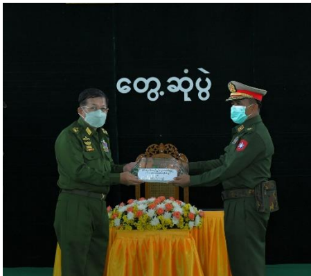
Min Aung Hlaing (left) at a meeting with officers and other ranks in Bago Region.

Myanmar people's loathing for the military dates back to the 1988 pro-democracy uprising when the army—just as junta chief Min Aung Hlaing is doing today—slaughtered pro-democracy protesters and persecuted dissidents.