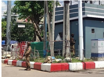
Caption - Two soldiers are seen in downtown Yangon on October 6

The PDF chapter of southern Yangon Region's Kayan Township fired grenades at four regime targets on October 7, including an administration office and a police station.