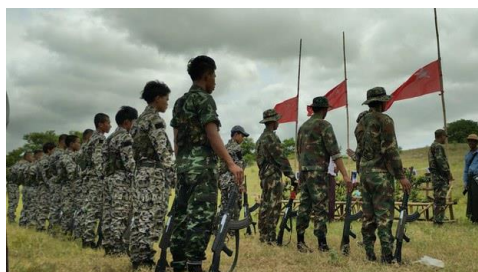
Undated photo of Wetlet People's Defense Force members. Wetlet People's Defense Force

Fighting over the weekend in northwestern Myanmar's restive Sagaing region between the military junta's soldiers and People's Defense Force (PDF) militias left 16 rebels dead, with some corpses showing signs of severe torture, local sources told RFA.