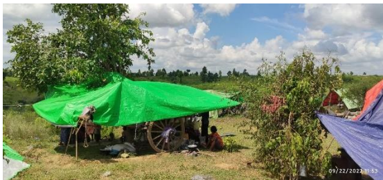
Displaced locals from eastern Khin-U township

The following morning, half of the column reportedly continued on to neighbouring Gway Kone, more than one mile away, where more homes were burnt.