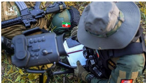
SSPP အမျိုးသမီးတပ်များ၏ စစ်ရေးပြလှုပ်ရှားမှု