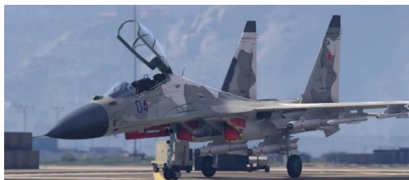
A Russian-made Su-30SME Fighter jet.