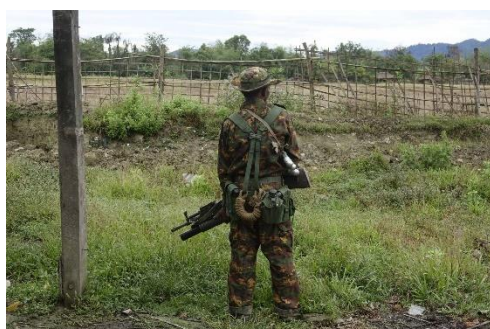
A Myanmar army soldier seen in Maungdaw Township in early 2018

Fighting broke out between the Arakan Army (AA) and the junta's armed forces near the Bangladeshi border in Rakhine State's northern Maungdaw Township on Thursday, locals said.