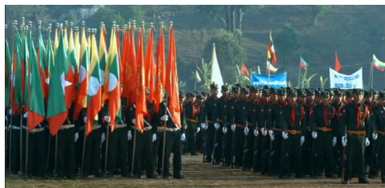
SSPP SSA troops.

Locals informed SHAN the Restoration Council of Shan State (RCSS) and the Shan State Progress Party (SSPP) exchanged fire for 20 minutes next to Loi Hung Mountain, located between Pan Haik and Hko Nam Tawng villages in Mong Ye village tract in the morning of 21 September.