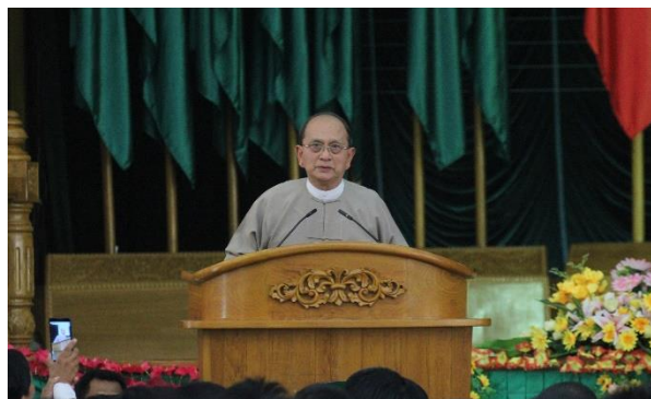
Ex-president U Thein Sein at the USDP headquarters in Naypyitaw in March 2017.

Now the USDP is again facing a future where different groups are vying for power. Some senior USDP figures want former president and USDP chair U Thein Sein to use his influence and intervene.