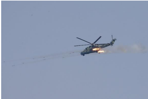
A Myanmar military Russian-made Mi-35 helicopter seen in 2018 during a military exercise in Ayeyarwady Region.

Teachers and villagers said the helicopters fired at least three rockets, as well as firing machine guns for nearly an hour. At the time of the attack, about 200 young students were attending classes.