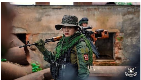
SSPP အမျိုးသမီးတပ်များ၏ စစ်ရေးပြလှုပ်ရှားမှု

ကျေးသီးမြို့နယ်တွင် ဖြစ်သည့် တိုက်ပွဲသည် RCSS တပ်ဖွဲ့ဝင်များက ရှမ်းပြည်နယ်မြောက်ပိုင်းသို့ အဖွဲ့ငယ်များခွဲကာ ဝင်ရောက်နိုင်ရေး ကြိုးပမ်းလာသဖြင့် SSPP တပ်ဖွဲ့ဝင်များနှင့်ဆုံကာ ပစ်ခတ်မှု ဖြစ်ပွားခြင်း ဖြစ်ကြောင်း တိုင်းရင်းသား အရေး စောင့်ကြည့်သူက ဆိုသည်။