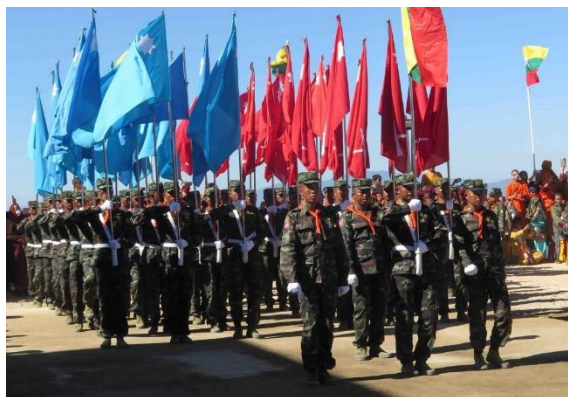
RCSS SSA troops.

The recent violence began after an RCSS column attacked SSPP soldiers crossing the road between Mong Nawng and Laikha, locals said. SHAN has sought comment from the spokespersons of the two armed groups, but no one has responded.