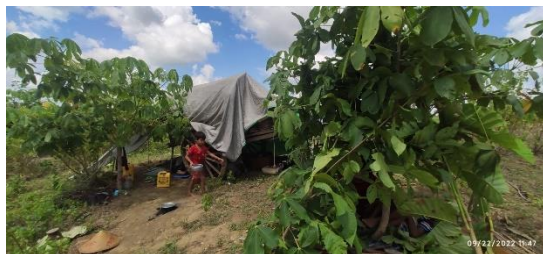
Displaced locals from eastern Khin-U township

By Thursday, locals in multiple villages along the highway had fled the military raids.