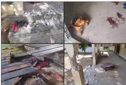
A school building damaged by a junta airstrike.

Mi-35 helicopters are mainly used to support infantry columns involved in heavy fighting. Now, though, the regime is using them along with MI-17 helicopters to launch surprise attacks in Sagaing Region, one of the strongholds of the resistance movement.