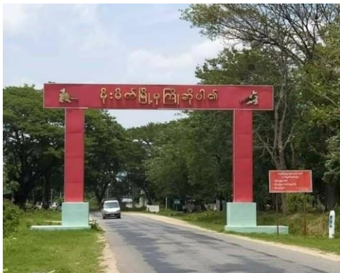
မိုးမိတ်မြို့

သျှမ်းပြည်မြောက်ပိုင်း မိုးမိတ်မြို့နယ်အတွင်း ဖြစ်ပွားသည့် အာဏာသိမ်း စစ်ကောင်စီ နှင့် ရှမ်းပြည်တိုးတက်ရေး ပါတီ၊ ရှမ်းပြည်တပ်မတော် (SSPP/SSA) တို့ တိုက်ပွဲကြား စစ်ကောင်စီမှ ၇ ဦး သေဆုံးပြီး လက်ရှိတွင် စစ်ဆေးရေး တင်းကြပ်နေကြောင်း သိရသည်။