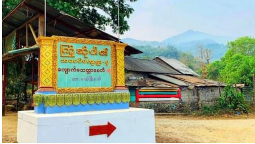
The signpost for Ba Wa Pin village in Tanintharyi region's Dawei township.

Among the nearly 180 junta troops, local battalion Numbers 401, 402 and other joint forces are still stationed in the village, a member of the Ah Shae Taw (East Forest) People's Defense Force (PDF) told RFA.