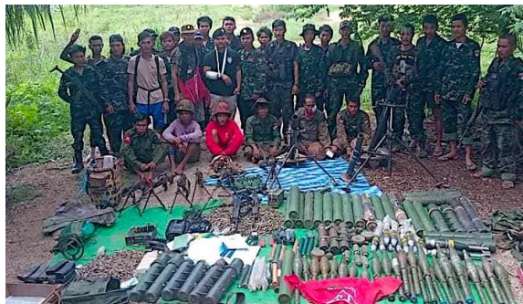
Karen National Union fighters after seizing Thay Baw Boe Camp.

The regime lost its five bases to the KNU in Mone Township, Bago Region, where KNU Brigade 3 is based.