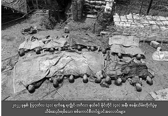
Border police killed at the Maungdaw outpost.