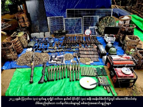
Weapons seized from a border police outpost in Maungdaw.