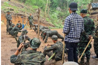
New recruits train with the KNU shortly after the coup, in May 2021.