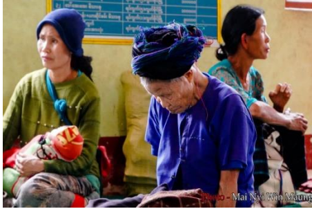
Villagers displaced by fighting in northern Shan State's Kutkai Township in May 2021

The incident occurred a day after the Kachin Independence Army (KIA) intercepted a 14-vehicle junta convoy near Nam Hpat Kar, a town on the Muse-Kutkai highway, sources said.