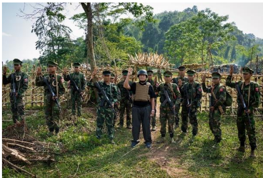
The NUG acting president visits a conflict zone

Now the regime has lost control of at least half the country to the NUG’s PDF groups and allied ethnic armed organizations, said the acting president in his state of the union speech on Wednesday, marking the first anniversary of the declaration of war against the junta. His statement was supported by the Special Advisory Council-Myanmar (SAC-M) a group of former UN experts on Myanmar. Their recent analysis finds that the NUG and resistance organizations have effective control over 52 percent of the territory of Myanmar.