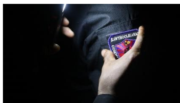
A soldier wears a Kawthoolei Army patch.

Taw Nee also said naming the breakaway group the “Kawthoolei Army” was another underhanded move by Nerdah Bo Mya.