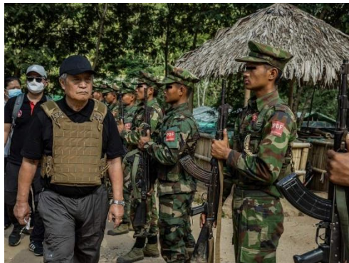
The NUG acting president inspects a frontline PDF camp.

Of the various leading roles Duwa Lashi La has played, the biggest of his life—serving as the country’s head of state—was also the most sudden.