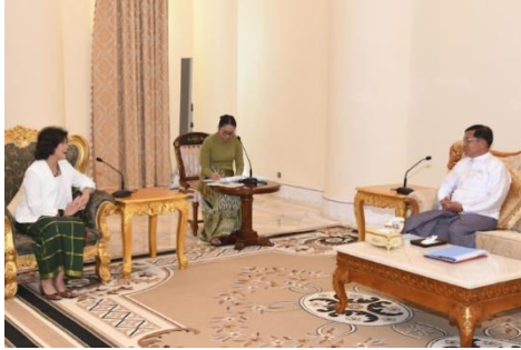
United Nations' new special envoy for Myanmar Noeleen Heyzer (L) talking with Myanmar military chief and Chairman of the State Administration Council Senior General Min Aung Hlaing (R) during their meeting in Naypyitaw, Myanmar, 17 August 2022.

But what is clear, as can be seen in our cover story for Mizzima Weekly this week, is that junta leader Min Aung Hlaing is spinning the UN envoy around his little finger.