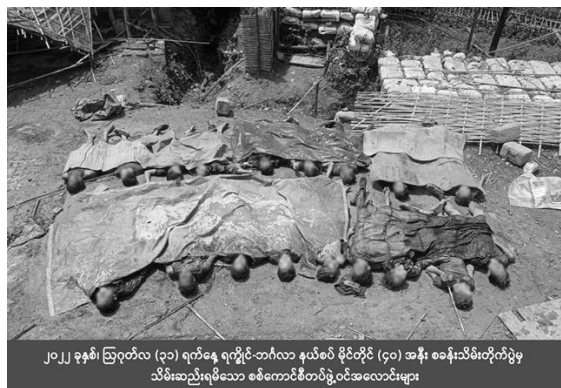
The bodies of junta police officers killed by the Arakan Army in Maungdaw Township, Rakhine State, on Wednesday.

On Sunday, three battalions based in the township and other regime forces bombed seven villages.