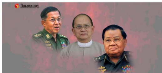
Junta leader Min Aung Hlaing (left), ex-president U Thein Sein (center) and former dictator Than Shwe.

Junta chief Senior General Min Aung Hlaing met former dictator Senior General Than Shwe more than once before extending military rule on August 1.