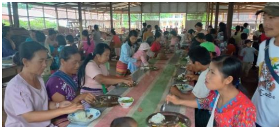
IDPs in Nawngkio having foods

“When the clashes stop, they’ll return to their village. Right now it’s impossible because the BA soldiers are staying in their villages. I think they’ll have to stay in Doe Pin for several days more.”