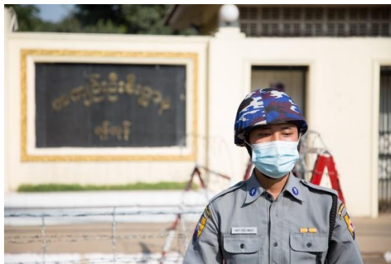
A police officer stands guard outside of Insein Prison.