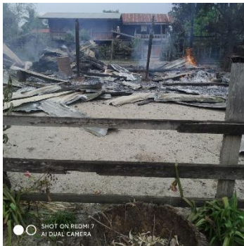
A village torched by junta troops in Kyunhla.

“We had 132 houses and now we could only see five to six. Almost all the houses have been torched,” said a villager.