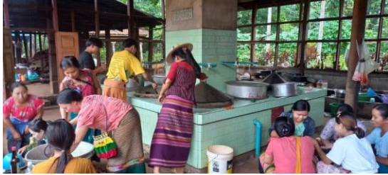
IDPs in Nawngkio

She explained that the food they were offered at the temple was quite simple. “Today we’ve eaten yellow bean curry and fried chili with rice.”