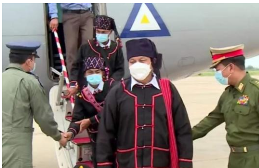
LDU နှင့် စစ်ကောင်စီ တွေ့ဆုံ

ဒုတိယအကြိမ် ငြိမ်းချမ်းရေး ကိစ္စရပ် တွေ့ဆုံဆွေးနွေးရန် တိုင်းရင်းသားအဖွဲ့အစည်းတချို့နှင့် အာဏာသိမ်းခေါင်းဆောင် မင်းအောင်လှိုင်တို့ နေပြည်တော်တွင် တွေ့ဆုံဆွေးနွေးနေကြောင်း စုံစမ်းသိရသည်။