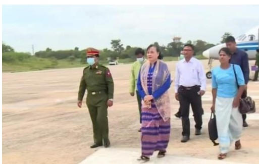
စစ်ကောင်စီနှင့် APL တွေ့ဆုံ

တွေ့ဆုံဆွေးနွေးမှုအပြီးတွင် အခြေခံသဘောတူညီချက်ရရှိရေးအတွက် ကြိုးစားနေမှုကြောင့် ဒီမိုကရေစီ အုပ်ချုပ်ရေး နှင့် ဖက်ဒရယ်အာဏာကို ရည်မှန်းပြီး ငြိမ်းချမ်းရေး ရရှိအောင် ကြိုးပမ်းနေသည့် အတွက် ငြိမ်းချမ်းရေး မရနိုင်စရာမရှိကြောင်းလည်း အာဏာသိမ်း ခေါင်းဆောင်က ဩဂုတ်လ ၁၆ ရက်တွင် ထုတ်ပြန် ပြောဆိုထားသည်။