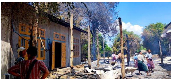
Houses torched by junta troops in Nyein San Village, Ayadaw Township on August 19.

Over 200 residents have fled the village since the abductions started. Local resistance groups have attacked the Pyu Saw Htee base in Ngwe Dwin Village three times, but to no avail. Seven Pyu Saw Htee militia were killed in those attacks, and so they are taking their anger out on the villagers, said a member of a local resistance group.