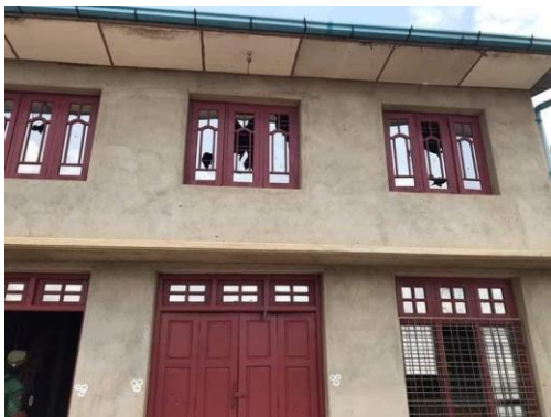
Damaged and abandoned house in Kyaukme

A male resident who requested anonymity explained that RCSS soldiers were already there before the arrival of the SSPP and TNLA.