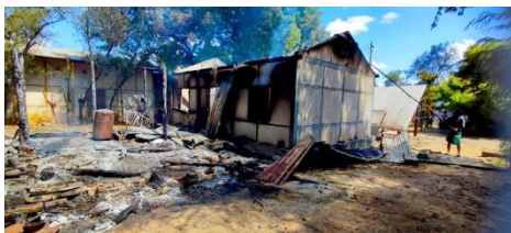
Houses torched by junta troops in Nyein San Village, Ayadaw Township on August 19.

Relatives of the detainees have been asked for a ransom of 2.5 million kyats for each abductee, said villagers.