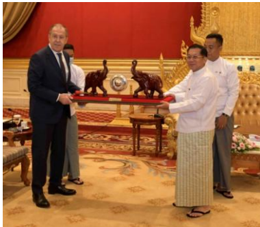
Min Aung Hlaing and Russian Foreign Minister Sergei Lavrov in Naypyitaw on Aug. 3.

Amid the international condemnation of the Myanmar military for its coup and of Russia for its invasion of Ukraine, Moscow and Naypyitaw are planning to open consulates in each other's countries, junta spokesman Major-General Zaw Min Tun told a regime press conference on Wednesday.