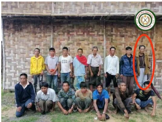
TNLA မှ ဖမ်းဆီးသွားသည့်သူများ

ထိုထဲတွင် အသက် (၆၀) အရွယ်ရှိ လုံးကျော်ဆွေလည်းပါဝင်ခဲ့ပြီး မိသားစုဝင်များ နှင့် သက်ဆိုင်ရာ ရပ်ရွာလူကြီးများ၏ ထောက်ခံမှုကြောင့် ဩဂုတ် ၇ ရက်တွင် ခြေလက်ရောင်ကိုင်ဒဏ်ရာ နှင့် ဝမ်းဗိုက်တလျှောက် ညှိမ့်ဒဏ်ရာဖြင့် ပြန်လွတ်လာကြောင်း နီးစပ်သည့် ဆွေမျိုးအမျိုးသားတစ်ဦးက သျှမ်းသံတော်ဆင့်ကို ပြောသည်။