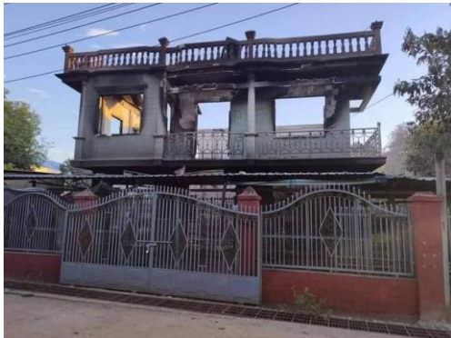
A house destroyed in Mu Kan Gyi, seen on August 11

“I don’t even dare go back there now,” she said. “I have nothing to go back to. I don’t know what I am supposed to do anymore,” she said.