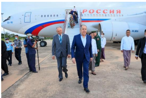
Russian Foreign Minister Sergey Lavrov arrives in Naypyitaw on Aug. 3.

When Russia invaded Ukraine, the regime backed the Kremlin , its spokesman saying that Russia was still a powerful nation that plays a role in keeping the balance of power for world peace.