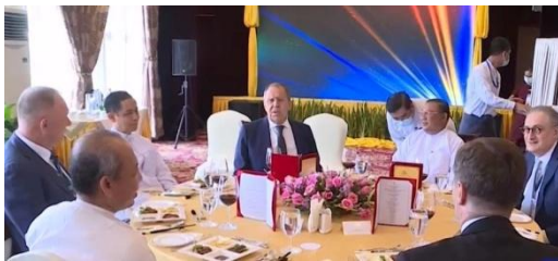
Regime Foreign Minister Wunna Maung Lwin hosts a luncheon for the Russian delegation at the Aureum Palace Hotel in Naypyitaw on Aug. 3.

Dragging Russia into the conflict in Myanmar will have major consequences.