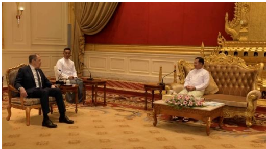
Myanmar regime leader Min Aung Hlaing receives Russian Foreign Minister Sergey Lavrov at the Credentials Hall in Naypyitaw on Aug. 3.

Lavrov made clear where Moscow stands to Myanmar ministers, who could not conceal their delight at the working luncheon.