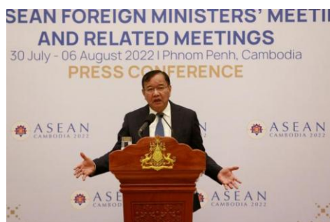
Cambodian Foreign Minister Prak Sokhonn holds a press conference at Ministry of Foreign Affairs in Phnom Penh, Cambodia, 06 August 2022.

The 10-country Association of South East Asian Nations (ASEAN) has spearheaded so far fruitless efforts to resolve the turmoil, and acknowledged in a joint statement on Friday the lack of progress around