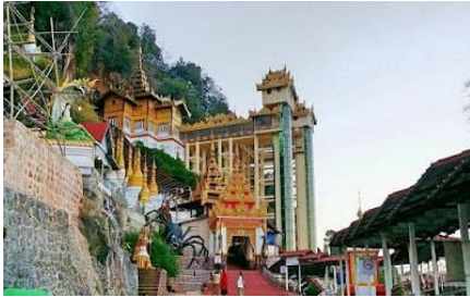
ပင်းတယမြို့

“ပင်းတယမှာက ဖမ်းဆီးခံထားရတာ အကြမ်းအားဖြင့် ဆိုရင်တော့ (၅၀) ကျော်လောက်ရှိတယ်။ သူတို့က ဖမ်းလိုက် ပြန်လွှတ်လိုက်ပဲ။ ဖမ်းပြီး စစ်ဆေးပြီးတော့ ပြန်လွှတ်တာမျိုးရှိပါတယ်။ အခုချိန်ထိတော့ ဘယ်နှစ်ယောက် ဖမ်းခံထားရလဲတော့ ကျနော်တို့လည်း အသေးစိတ်မသိရတော့ဘူး” ဟု ပင်းတယမြို့ ဒေသခံ အမျိုးသားတစ်ဦးက ပြောသည်။