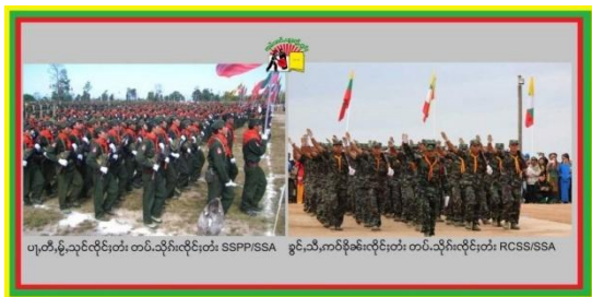
SSPP SSA and RCSS SSA

"They are afraid of forced recruitment by the Shan armed groups. Some youths and children from Wan Mai slept in Panglong town last night (3 August) because they did not want to be taken away. Others have moved into the town."