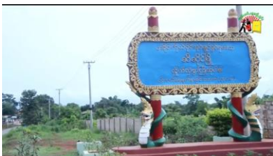
ဆီဆိုင်မြို့

ပြီးခဲ့သည့် ဇွန်လပိုင်းတွင် ဆီဆိုင်မြို့နယ် ပါလောပါကယ်ကျေးရွာအုပ်စုမှ ကျောင်းဆက်မတက်ဘဲ အလုပ်သွားလုပ်သည့် ကျောင်းသား၊သူ တချို့၏ မိဘများထံ (PNO) ပြည်သူ့စစ် တပ်ဖွဲ့နှင့် ကျောင်းဆရာများက ညှိနှိုင်းပြီး မြန်မာကျပ်ငွေ (၁) သိန်းအထက် ဒဏ်ငွေဆောင်ခိုင်းပြီးကြောင်း ဆီဆိုင်မြို့မှ ကျောင်းသားမိဘတစ်ဦးက သျှမ်းသံတော်ဆင့်ကို ပြောသည်။