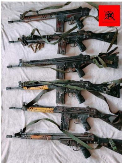
Weapons seized by PDF fighters during an attack on Sunday on a regime vehicle in Taze Township, Sagaing Region.

Also on Saturday, Myaung Revolution Army (MRA) claimed that a combined force of PDFs killed at least 22 Myanmar military soldiers when they used landmines to ambush regime forces in Sagaing Region's Chaung-U Township.