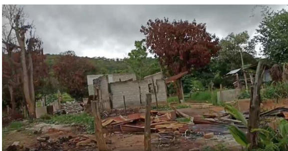
Saung Nang Khae is seen two months after it was destroyed by junta forces in May

According to a spokesperson for the Pekhon People’s Defence Force (PDF), dozens of houses have also been torched in deserted villages that are now occupied by regime forces.