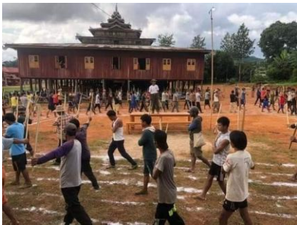
PNO မှ စစ်သင်တန်းပေးနေပုံ

အဆိုပါ PNO တပ်ဖွဲ့များသည် အထူးဒေသ (၆) နယ်မြေတွင် စစ်သင်တန်း စားရိတ်အတွက် တစ်အိမ်လျှင် မြန်မာကျပ်ငွေ (၃၀,၀၀၀) နှင့် ဆန် (၁) ပြည်ကို ကောက်ခံခဲ့ပြီး ယခုအချိန်ထိ လုံခြုံရေး စစ်သင်တန်းသားများ ချထားမှုမရှိသေးကြောင်း ဆီဆိုင်မြို့နယ် အသက် (၃၀) ကျော် ဒေသခံ အမျိုးသားတစ်ဦးက သျှမ်းသံတော်ဆင့်ကို ပြောသည်။