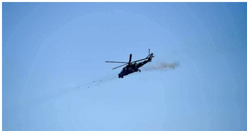
The Mi-35 combat helicopter / CJ

The spokesman of the township People's Defense Force and some locals said two choppers airlifted some 80 junta soldiers from Phayahtwet Village to Kaingkan Village while the Mi-35 carried out the attacks.