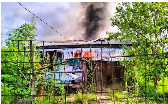
ယနေ့မနက် စစ်ကောင်စီက လက်နက်ကြီးဖြင့် ပစ်၍ မီးလောင်ပျက်စီးနေသည့် မိုးမြဲမြဲ ပေါ်မှ နေအိမ်အချို့

မိုးမြဲအခြေစိုက် တပ်ရင်း ၄၂၂ နှင့် ကရင်နီ ပြည်နယ်မှ စစ်ကောင်စီတပ်များ လူလဲရန်အတွက် လာရောက်စဉ် ပြည်သူ့ ကာကွယ်ရေး တပ်ဖွဲ့များနှင့် နံနက် ၂ နာရီခန့်က တိုက်ပွဲဖြစ်ပွားခဲ့ပြီး ၂ ဖက် တပ်ဆုတ်ကာ တိုက်ပွဲ ခဏတာ ငြိမ်သက် ခဲ့သည်။