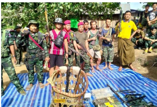
KNDO members pictured after taking over the Waw Lay police station on June 13

Tin Htet Paing / Linn Htin / Maung Shwe Wah | Published on Jul 17, 2022