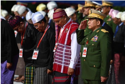
Myanmar military chief Min Aung Hlaing (right) salutes during the Martyrs' Day ceremony in Yangon on July 19, 2019.

But neither Min Aung Hlaing nor his acting president Myint Swe attended the 74th Martyrs' Day last year, held under military rule for the first time since the February 2021 coup, which saw the detention and imprisonment of President U Win Myint, State Counselor Daw Aung San Suu Kyi and many NLD cabinet members. Last year, Min Aung Hlaing assigned Culture Minister U Ko Ko, who is merely a former air force colonel, to organize the event.