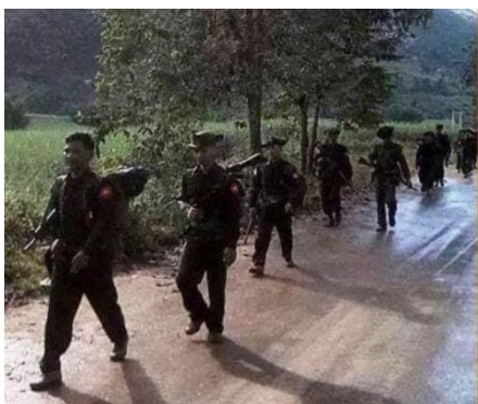
စစ်ကောင်စီ

လက်ရှိ မိုင်းရှူးမြို့ဝင် မြို့ထွက်စစ်ဆေးရေးဂိတ်များတွင် စစ်ကောင်စီတပ်သားနှင့် ရဲတို့၏ စစ်ဆေးမေးမြန်းမှုများ အရင်ကထက် ပိုမို တင်းကြပ်လာကြောင်းလည်း ဒေသခံအမျိုးသားတစ်ဦးက သျှမ်းသံတော်ဆင့်ကို ဆက်လက်ပြောဆိုထားသည်။