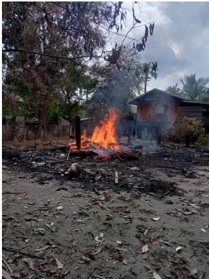
ဂန့်ဂေါမြို့နယ် ညောင်လယ်ကျေးရွာတွင် မီးရှို့ခံထားရသည့် နေအိမ်များ

ရရာတူမီး သေနတ်၊ လေသေနတ်တွေနဲ့ ခုခံနေတဲ့ ကလေးမြို့ခံတွေ အခြေပြုရာ တာဟန်းရပ်ကွက်က သပိတ်ခံတပ် နေရာကို စစ်တပ်က မတ်လ ၂၈ ရက်မှာ စတင် ဖြိုခွင်းပါတယ်။ လက်နက်ကြီး၊ လက်နက်ငယ်တွေနဲ့ မဲမဲမြင်ရာကို ပစ် ခတ်ကြတာပါ။