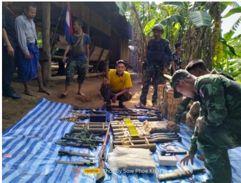
Weapons and ammunition seized by the KNDO

The plan worked. Despite there being some 100 troops stationed at the base, none appeared to be aware of the parallel operation at the police station, instead firing artillery shells in an effort to protect the tactical officer located inside the post.