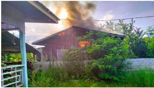
ယနေ့မနက် စစ်ကောင်စီက လက်နက်ကြီးဖြင့် ပစ်၍ မီးလောင်ပျက်စီးနေသည့် မိုးမြဲမြဲ ပေါ်မှ နေအိမ်အချို့

ဒေသခံ တဦးကလည်း “မနက်ပိုင်း ဘုရားကျောင်းမှာ ဖာသာတွေ၊ မာသာတွေတော့ ပိတ်မိတာ။ ၉ နာရီ ၁၀ နာရီဝန်း ကျင်လောက်မှာ မိပြီးတော့ ပြန်တော့ လွှတ်လိုက်ပြီ။ တိုက်ပွဲနား အနီးတဝိုက်က လူတွေတော့ သွားကြပြီ။ တချို့လည်း ဘုန်းကြီးကျောင်းတွေနားမှာ မပြေးနိုင်တဲ့ လူတွေကို ထားတယ်။ သက်ကြီးရွယ်အိုတွေကို နေရာ ရွှေ့ထားခိုင်းတယ်” ဟု ပြောသည်။