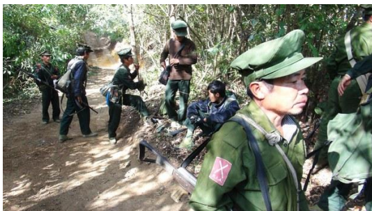
ကချင်လွတ်မြောက်ရေး တပ်မတော် (KIA) တပ်ဖွဲ့ဝင်တချို့အား တွေ့ရစဉ်

ကချင်ပြည်နယ် ဖားကန့်မြို့နယ် ဆယ်ဇင်းရွာနားမှာ ကချင်လွတ်မြောက်ရေး တပ်မတော် ( KIA) နဲ့ စစ်ကောင်စီတပ်တို့ နှစ်ရက်ဆက် တိုက်ပွဲပြင်းထန်နေပြီး ဇူလိုင်လ ၁၇ ရက် ဒီနေ့ မှာ စစ်ကောင်စီဘက်က လေကြောင်းနဲ့ပါ တိုက်ခိုက်နေတယ်လို့