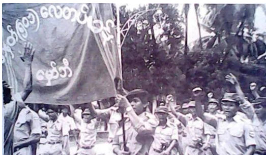
ရှစ်လေးလုံး အရေးတော်ပုံတွင် လူထုနှင့် အတူရပ်တည်ခဲ့ကြသည့် လေတပ် တပ်မတော်သားများ

ဖြေ ။ ။ စစ်မြေပြင်နဲ့ စစ်ရေးအရတော့ ရာနှုန်းတခု အကျိုးရှိတယ်လို့ ယုံကြည်တယ်။ အကျိုးရှိတယ်လို့ ယုံကြည်ပေမယ့် အဆိုးဘက်ကိုလည်း ရောက်သွားနိုင်တာပေါ့။ ဥပမာ - စစ်တိုက်တဲ့အခါမှာ အမှားအယွင်းဆိုတာ ရှိတတ်တယ်။ အဲဒီနေရာမှာ စစ်တပ်ကလာတဲ့လူသာ ဦးဆောင်ရင် တော်တော်ခက်တာပေါ့။ ကျနော်တို့ ခေတ်တုန်းကလည်း တောခို လာတဲ့ CDM စစ်သားတွေ ကြားထဲမှာ သံသယဝင်ခံရတာ ရှိတာပဲ။ လွန်ခဲ့တဲ့ အနှစ် ၃၀ ကျော်တုန်းကလည်း သံသယ ဝင်ခံရတဲ့ စကားလုံးတွေနဲ့ တိုက်ခိုက်တာတွေ၊ ဘေးဖယ်ခံရတာတွေ ရှိတယ်။ ပြစ်တင်ရှုတ်ချတာတွေလည်း ရှိတယ်။ ဒါကို ကျော်ဖြတ်ပြီးတော့ပဲ ကိုယ့်စိတ်ထဲ ယုံကြည်တာကို ဆက်လုပ်လာကြတာပေါ့။