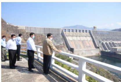
Min Aung Hlaing visits the Yeywa hydropower project in Mandalay in January

The junta simultaneously opened bidding on six hydropower projects throughout the country on Tuesday in an attempt to expand the sector, which has been long protested by the public and civil society for causing