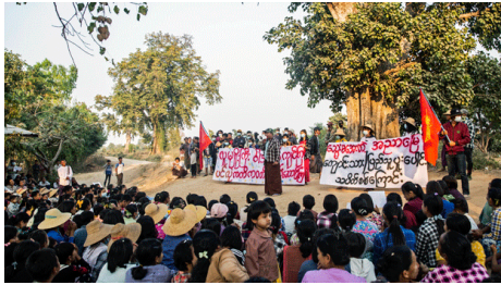
Protesters participate in a demonstration against the military junta in Ayadaw township, northwestern Myanmar's Sagaing region, Feb. 13, 2022.

under Myanmar's ruling military regime because they hail from the part of the country with the greatest armed resistance to the junta, locals said Friday.