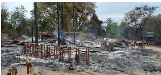
ဝက်လက်နယ်အတွင်းရှိ မီးရှို့ခံရသည့် ကျေးရွာတချို့

ထိုသို့ ၂ ရက် ဆက်တိုက်ဖြစ်ပွားခဲ့သော တိုက်ပွဲတွင် ဒေသကာကွယ်ရေးမဟာမိတ်တပ်များ၏ စနိုက်ပါ ပစ်ခတ်မှု အပါအဝင် လက်နက်ကြီး ပစ်ခတ်မှုများကြောင့် စစ်ကောင်စီတပ်မှ ၄၀ ဦးခန့်ထိ သေဆုံးကြောင်း Tiger King(တပ်ရင်း ၁၅) ၏ ထုတ်ပြန်ချက်တွင် ဖော်ပြထားသည်။