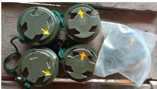
A file photo of unexploded ordnance.

Landmines and unexploded ordnance (UXO) in Myanmar have maimed or killed at least 115 children since the military junta seized power last year, UNICEF Myanmar reported on June 24. The report said that one-third of all landmine and UXO casualties it tracked from the February 2021 coup to April 2022 were children.