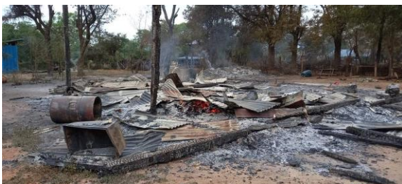
ဝက်လက်နယ်အတွင်းရှိ မီးရှို့ခံရသည့် ကျေးရွာတချို့

“ဝက်လည်ရွှဲကျေးရွာက CDM ကျောင်းဆရာတဦးရဲ့ နေအိမ်ကိုလည်း မီးရှို့သွားတယ်။ ဝက်လည်ရွှဲကျေးရွာနဲ့ လေးကုန်း လေးကျေးရွာတွေကို မီးရှို့ဖျက်ဆီးပြီး ၂ ရက်နေ့ ညပိုင်းမှာပဲ မင်းရွာထဲကို ဝင်တယ်။ ည ၁၂ နာရီလောက်မှာ မီးစရှိတယ်။ သူတို့ ဝင်ကတည်းက ရွာသားတွေက နီးစပ်ရာကို ပြေးကြရတာပေါ့ ” ဟု စစ်ဘေးရှောင်များအား ကူညီပေးနေသူတဦးက ပြောသည်။