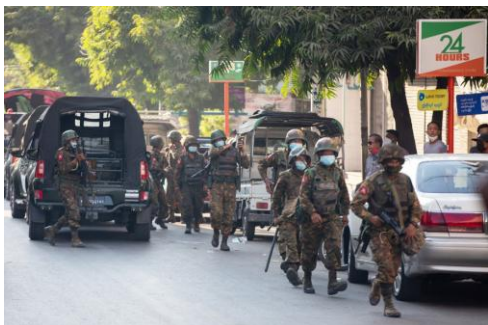
Armed junta soldiers are seen in Mandalay on February 15, 2021