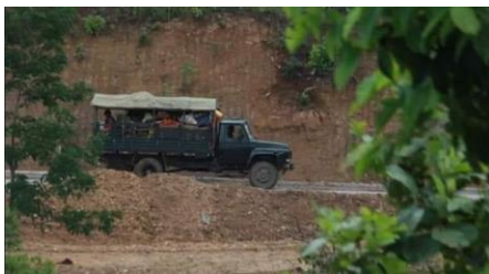
စစ်ကောင်စီ ကား

သျှမ်းပြည်မြောက်ပိုင်း မူဆယ်မြို့နယ် မုံးပေါ် နှင့် မုံးကိုးကြားရှိ ဝိန်းဆိုင်ရွာ အနီးတွင် အာဏာသိမ်း စစ်ကောင်စီ တပ်ဖွဲ့ နှင့် ကိုးကန့်တပ်မတော် MNDA တို့ ကြား ထိတွေ့တိုက်ပွဲ ဖြစ်ပွားခဲ့ခြင်း ဖြစ်ကြောင်း သတင်းသိရသည်။