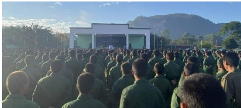
SSPP တပ်သားများ

သျှမ်းပြည်တောင်ပိုင်း ပင်လုံမြို့ရှိ ဆနင်း နှင့် ဖောင်းဆိုင်ဒေသအတွင်း မူးယစ်ဆေးဝါး တိုက်ဖျက်ရေး လုပ်ဆောင်မည့်ကို အကြောင်းပြပြီး အဆိုပါ ဒေသအတွင်း လှုပ်ရှားနေသည့် တပ်များကို ဆုတ်ခွာပေးရန် စစ်ကောင်စီ၏ တောင်းဆိုမှုကို လက်မခံကြောင်း SSPP/SSA က တုံ့ပြန်ပြောဆိုသည်။