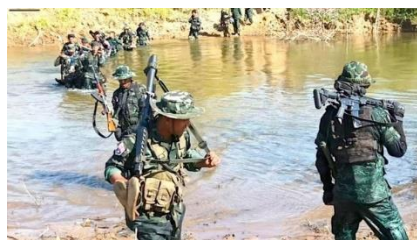
Karenni National Liberation Army joint forces in Kawkaik township on Dec. 17, 2022.

KNLA White Tiger Column Division-2 Information Group