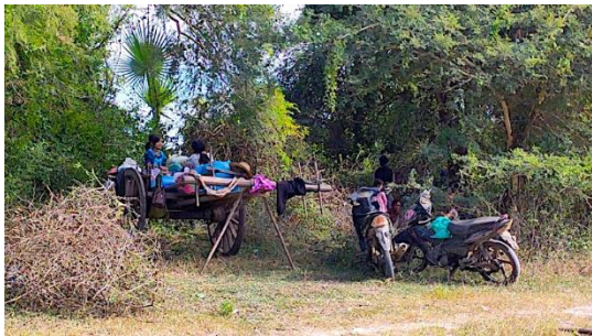
ခင်ဦးနယ်ထဲရှိ စစ်ဘေးရှောင် ပြည်သူများ

ယနေ့အထိ ခင်ဦးတွင် ဝင်နေသည့် စစ်ကြောင်း ၅ ကြောင်းတွင် အနည်းဆုံး အင်အား ၅၀ တွင် ရှိနေပြီး လူအင် အားများ ထပ်မံ ဖြည့်တင်းရုံမက ကားဖြင့် လက်နက်ခဲယမ်း ပေးပို့ခြင်းများလည်း ရှိနေကြောင်း သိရသည်။