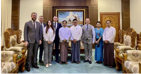
A delegation of high-level Russian academics meet junta-appointed International Cooperation Minister U Ko Ko Hlaing on Nov. 23

Moscow has emerged as the largest arms supplier to the military junta since the coup, while also defending the regime on the international stage and providing diplomatic support. The