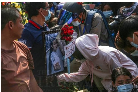
စစ်ကောင်စီ ပစ်သတ်လို့ ကျဆုံးသွားခဲ့ရတဲ့ မကြယ်စင် ဈာပန အခမ်းအနား (ဓာတ်ပုံ - ဧရာဝတီ)

၎င်းက “သူတို့ကို အပြစ်ပေးအရေးယူနိုင်တဲ့ အခင်းအကျင်းက အရမ်းအားနည်းတဲ့အခါကျတော့ ကျူးလွန်နေတဲ့သူတွေက ဆက်လက်ကျူးလွန်ဖို့ အတွက် အခွင့်အရေးရနေတဲ့ပုံစံဖြစ်နေတာပေါ့။ ဒါကြောင့်မို့ အမျိုးသမီးတွေက ထိခိုက်နစ်နာပြီး အသက်ပေးရတဲ့ အခြေအနေတွေ ပိုရောက်လာတယ်လို့ ကျမက မြင်တယ်” ဟု ဧရာဝတီသို့ ပြောသည်။