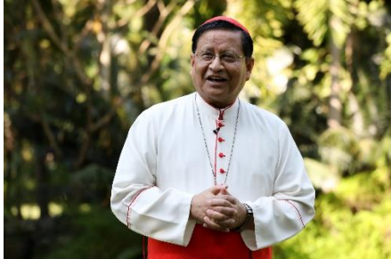
Cardinal Charles Maung Bo

Residents said that nearly 80 junta soldiers burned houses on Thursday afternoon in Mone Hla Village in Sagaing Region's Khin-U Township, where Cardinal Charles Maung Bo, the Archbishop of Yangon, was born.