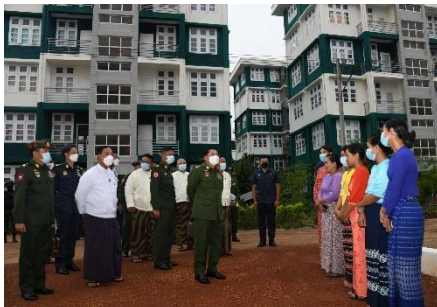
Junta chief Min Aung Hlaing inspects housing for war veterans in South Dagon Township, Yangon on May 26.

Min Aung Hlaing has warned his regime's regional and state governments to make sure projects being implemented by them are making progress and achieving their stated purposes.