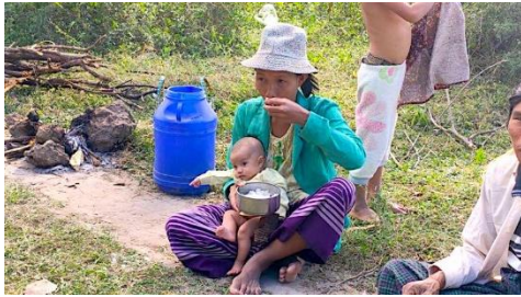
ခင်ဦးနယ်ထဲရှိ စစ်ဘေးရှောင် ပြည်သူများ

ထိုသို့ ရက်ဆက် စစ်ကြောင်းထိုးနေမှုများကြောင့် ခင်ဦးမြို့နယ်တွင် ကျေးရွာပေါင်း ၂၅ ရွာခန့်က ပြည်သူ နှစ်သောင်း ကျော် ထွက်ပြေးတိမ်းရှောင်နေရကြောင်း မြို့နယ်ပြည်သူ့ ကာကွယ်ရေးတပ်ဖွဲ့ထံမှ သိရသည်။