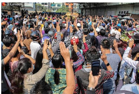
စစ်ကောင်စီ ပစ်သတ်လို့ ကျဆုံးသွားခဲ့ရတဲ့ မကြယ်စင် ဈာပန အခမ်းအနား

အမျိုးသမီး အနည်းဆုံး အယောက် (၄၀) သည် စစ်တပ်မှ ဖမ်းဆီးထားစဉ် သတ်ဖြတ်ခံခဲ့ရခြင်းဖြစ်ပြီး အယောက် (၂၀) ကမူ အရှင်လတ်လတ် မီးရှို့ခံခဲ့ရကြောင်း FEM က ပြုလုပ်ထားသော မှတ်တမ်းများအရ သိရသည်။