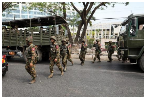
Soldiers at a protest in Yangon on February 15, 2021

The country has seen a grisly surge in beheadings since the coup – with both pro-military and anti-military figures targeted – a pattern observers say reflects the military's brutality and the subsequent rage of the people it oppresses.