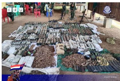
Weapons and ammunition seized during raids on junta bases in Bago Region's Shwegyin Township on November 12

A resident of Shwegyin told Myanmar Now that at least 2,000 displaced villagers are currently sheltering in the town, including 500 who arrived on the day of the raids.