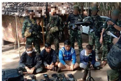
Four captured policemen are seen after the raid on Chaung Hnit Khwa station by resistance forces (Red Dragon Column)

Hundreds of Myanmar military troops occupied a Mon State village after a coalition of armed resistance groups raided a local police station, killing three junta personnel and capturing four alive on Saturday.