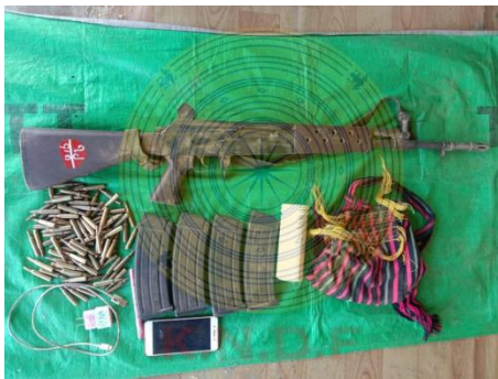
Weapons and ammunition seized by the KNDF during an ambush against regime forces in Loikaw Township, Kayah State on Sunday.

Battalion 10 of the Karenni Nationalities Defense Force (KNDF) claimed to have killed three regime forces including a captain when it ambushed five junta troops transporting rations to a military camp in Lawpita, a small town in Loikaw Township in Kayah State on Sunday.