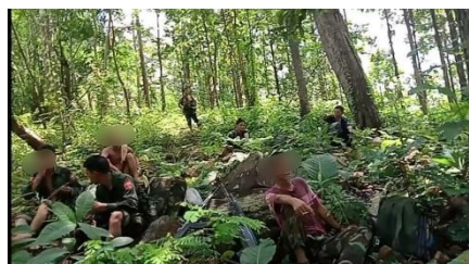
Resistance fighters of the KIA and a PDF group in upper Sagaing Region. / Indaw Revolution

Four regime forces were killed and five others injured in Indaw Township, Sagaing Region on Sunday when the Kachin Independence Army (KIA) and allied PDF groups attacked 100 regime forces traveling to Nann Ma Kyaing Village in the township, said Indaw Revolution, the media wing of the local PDF groups.