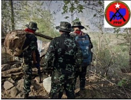
Resistance fighters of Paungde-PDF during an operation.

First, the PDF group used a cluster of six land mines to ambush 50 regime forces raiding the Bago Mountain Range that afternoon. In the ambush, three regime forces were injured seriously, the Paungde-PDF claimed.