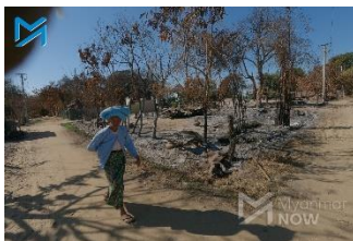
A woman walks past the remains of a house burned by junta troops in the village of Kyi Su in Sagaing Region's Kanbalu Township on December 8

Khin Yi Yi Zaw | Published on Dec 15, 2022