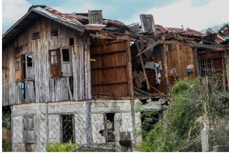
A house destroyed by Myanmar military aircraft in Moebye, southern Shan State, on September 8

to the annual National Defense Authorization Act (NDAA), is expected to become law within weeks after passing by a floor vote in the US Senate.