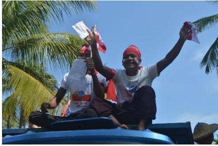
An ANP rally in Thandwe, Rakhine State in October 2015

The AFP, headed by Dr Aye Maung, is possibly the only Arakanese party that occasionally attends the military council's meetings and conferences regarding the PR system set to be used in the upcoming polls.