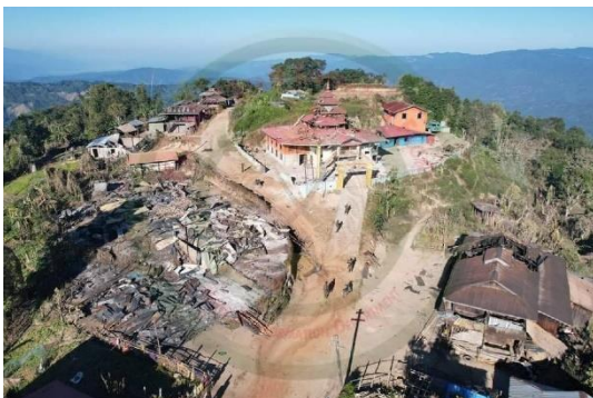
The monastery that was destroyed in Kone Thar village, Namhsan Township (TNLA)

The Myanmar army escalated its aerial bombardment of northern Shan State after reportedly suffering serious losses on the ground during days of clashes with the Ta’ang National Liberation Army (TNLA) in Namhsan Township.