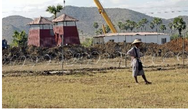
A villager is seen near the Letpadaung copper mine in December 2014

Despite security concerns since last year's coup, the mine, which is run by a subsidiary of China's Wanbao Mining and the Union of Myanmar Economic Holdings, Ltd, a military-owned conglomerate, continues to operate, according to the CDM worker.