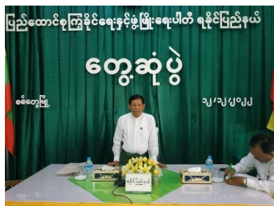
USDP meeting in Sittwe on December 12 (USDP)

Ethnic Rakhine parties—including the Arakan National Party (ANP), Arakan Front Party and the Arakan League for Democracy—typically garnered the most public support in the state in past elections, along with the National League for Democracy (NLD), whose national government was ousted in the February 2021 coup. The USDP has not historically had a foothold in the region.