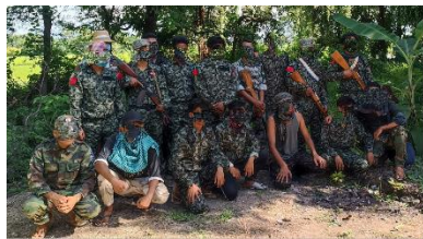
Members of the Ye-U Freedom Comrades-YFC resistance group

Many regime forces are believed to have been killed in Ye U Township, Sagaing Region on Wednesday when two PDF groups attacked a military detachment near an irrigation canal, claimed Ye U Freedom Comrades-YFC, which was involved in the operation.