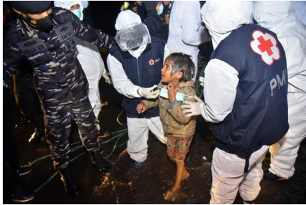
Medical workers help a girl as she arrives with a group of 120 Rohingya at Krueng Geukueh Port in North Aceh, Indonesia, Dec. 31, 2021.

Many of the stateless people have grown desperate because they see no hope of being repatriated to Myanmar, which is convulsed with violence following the February 2021 military coup, rights advocates and NGOs in the region said. The Rohingya also cannot work or educate their children properly at refugee camps in neighboring Bangladesh, where they are prohibited from leaving the camps' confines.