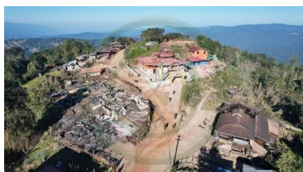
Damaged Koong Sar village.

According to an anonymous source close to the armed group fighting the military government, the Ta'ang soldiers found 47 bodies and captured 24 soldiers alive during a sweep of the battlefield near Koong Sar (Kon Tha) on Tuesday. Junta soldiers stationed at the Koong Sar Buddhist monastery were fired upon by their comrades, the man told SHAN, adding that the air strikes also damaged at least 7 houses in the village.