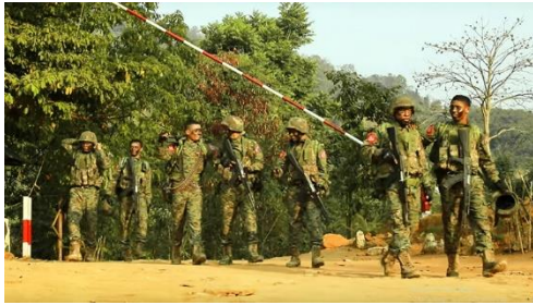
ရက္ခိုင့် တပ်တော် (AA)၏ တပ်ဖွဲ့ဝင်များ/DMG

သို့သော် ထိုတိတ်ဆိတ်နေသောကာလတွင် AA သည် ထိုအချိန်ကာလကို သူ့အတွက်အကျိုးရှိအောင် မြန်မြန်ဆန်ဆန် ခြေသွက်လက်သွက် ဆောင်ရွက်ခဲ့သည်။