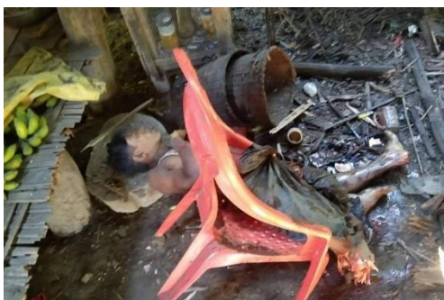
The body of a man killed by army shelling in Chaung Tu on November 16

There were also reports that a military aircraft dropped bombs near another village in Maungdaw Township on Wednesday.