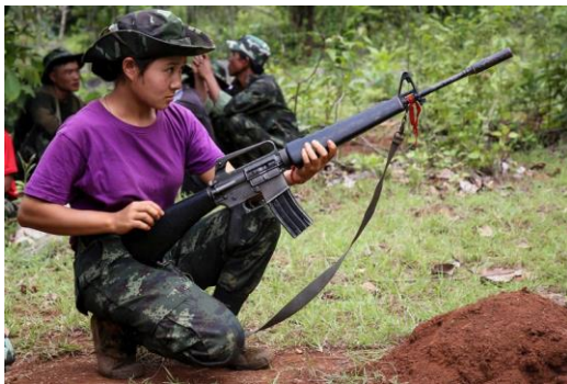
A member of the Karenni Nationalities Defence Force (KNDF) takes part in training for female special forces members in Myanmar's eastern Kayah state this year. Despite losses on the battlefield to ethnic resistance organizations and People's Defense Forces, the junta feels it can win by outlasting its opponents' will to fight.

The U.S. and the West have always said that ASEAN has to be the lead to any political resolution to the crisis in Myanmar. So it's essential for the junta to try to preempt the bloc from rejecting the election's results, before they've even happened.