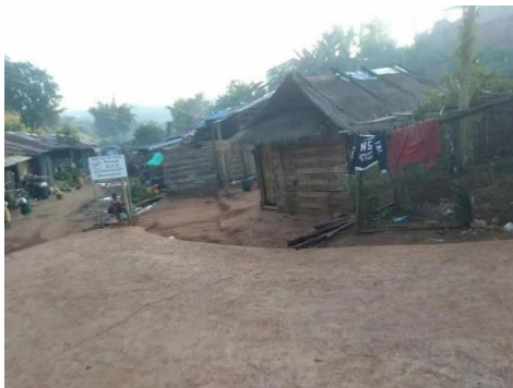
နမ့်ဟူး စစ်ရှောင်ပုံ

တိုက်ပွဲကြောင့် ကျေးရွာအနီးများတွင်ရှိနေသည့် မြေမြုပ်မိုင်းနှင့် လက်နက်ခဲယမ်းအန္တရာယ်များအတွက် အကာအကွယ် ပေးမှုများပြုလုပ်ပြီးမှ သာနေရပ်ပြန်ရေးကို ဆောင်ရွက်သင့်ကြောင်းလည်း စစ်ဘေးရှောင်ကူညီသူများက ထောက်ပြ ပြောဆိုလိုက်သည်။