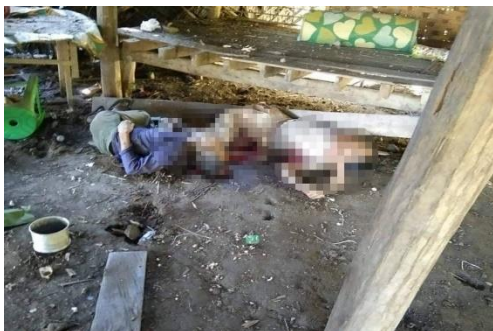
The bodies of two civilians killed in Chaung Tu, Kyauktaw Township, on November 16

Most of the victims were older people who were sitting outside drinking tea when the shelling began, said one local woman.