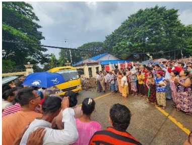
Families wait outside Insein Prison as prison authorities begin to release detainees granted an amnesty on November 17

Also granted amnesty were the ousted minister of the State Counsellor's Office Kyaw Tint Swe and former Tanintharyi Region chief minister Le Le Maw, who had been sentenced before the coup to 30 years behind bars for corruption.