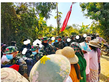
မကွေးတိုင်း အတွင်း လှုပ်ရှားနေသည့် ပြည်သူ့ကာကွယ်ရေးတပ်များ

ဆောမြို့နယ်အတွင်းရှိ Non-CDM ဝန်ထမ်းများ အားလုံးကိုလည်း ဖေဖော်ဝါရီ ၅ ရက်၊ ည ၁၂ နာရီ နောက်ဆုံးထားပြီး ပြည်သူ့ရဲခွင် ခိုလှုံရန် ဆော ပအဖက ဇန်နဝါရီ ၃၀ ရက်စွဲဖြင့် သတိပေးစာ ထုတ်ပြန်ခဲ့သည်။