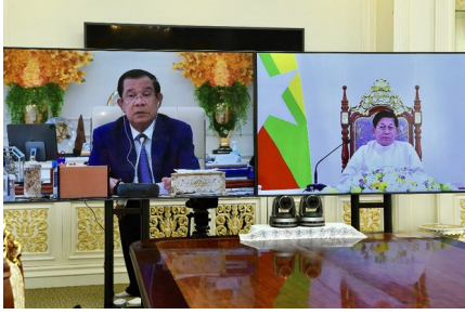
Cambodia's Prime Minister Hun Sen (L) and Myanmar's military chief Min Aung Hlaing (R) on screens during their video meeting, Jan. 26, 2022.

Only a month and a half into assuming the rotating leadership of ASEAN, Cambodia's prime minister admitted that Myanmar's military regime has made no progress in resolving the situation in the country and said it is unlikely to do so during the remainder of his year as chair.