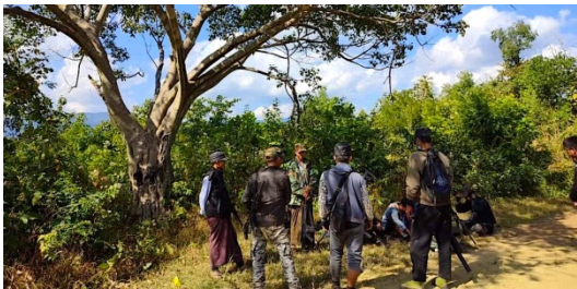
ဝိုလ်နဂါးဦးဆောင်သည့် မြန်မာ့ တော်ဝင်နဂါး တပ်ဖွဲ့ဝင်များ

ယင်းနေ့ တိုက်ခိုက်မှုတွင် ပြည်သူ့ကာကွယ်ရေးတပ်ဖွဲ့များဘက်မှ ၁ ဦး ကျဆုံးပြီး ၄ ဦး ဒဏ်ရာ ရရှိခဲ့ကြောင်း သိရ သည်။