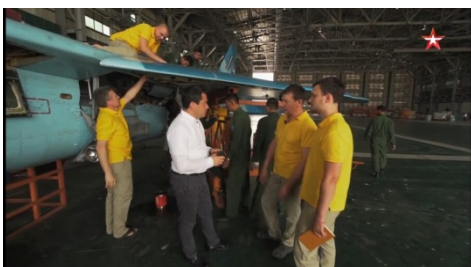
Russian technicians are seen at a military hangar in 2018.