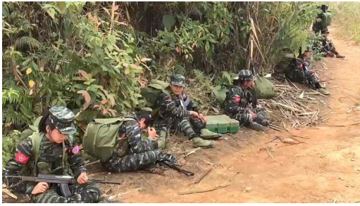
Fighters with the Arakan Army rest along a path, in a file photo. Arakan Army

lives of millions of ethnic minorities in the region at risk, according to a new report by an international NGO.