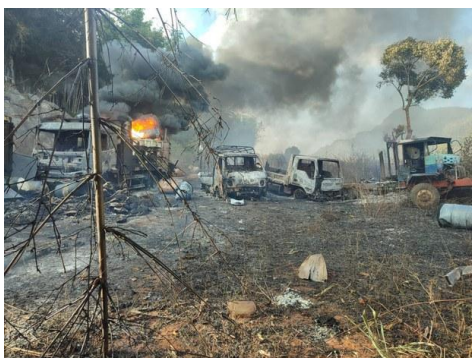
Smoke and flames billow from vehicles in Kayah state's Hpruso township, Dec. 24, 2021.

Myanmar's military has subjected ethnic civilians in Kayin and Kayah states to "collective punishment" through aerial and ground attacks, detentions that lead to torture or extrajudicial executions, and the razing of villages, according to a new report by London-based rights group Amnesty International.