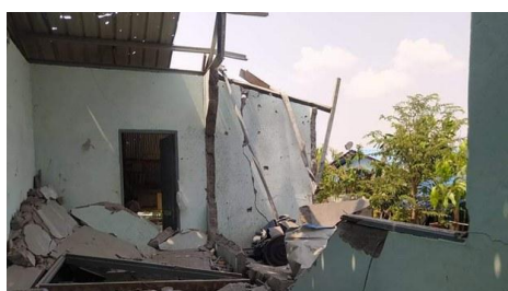
A school destroyed by a military airstrike in Lay Kay Kaw, April 11, 2022.

The group also documented eight air strikes on villages and camps housing refugees fleeing clashes in the first quarter of 2022 that killed nine civilians and injured at least nine others. Eyewitnesses described the attacks on locations where “only civilians appear to have been present” as extremely traumatic, leaving many unable to sleep or unwilling to return to their homes out of fear that they would be targeted again.