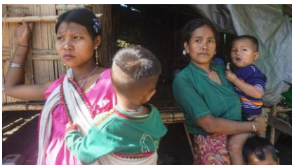
Refugees at a camp in Rakhine state's Ponnagyun township, Jan. 21, 2022. 'The view of the people'

And while many in Myanmar would welcome a partnership against the junta between the AA and the NUG-led opposition, the report suggested that such an arrangement could spark violence that would significantly worsen the living situation for civilians in Rakhine state, which is already reeling from a battered economy and years of communal violence.