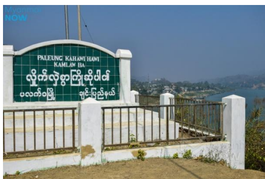
A sign marks the entrance to Paletwa

Regime forces opened fire with heavy artillery during a clash with the Arakan Army (AA) in southern Chin State's Paletwa Township on Thursday, according to local sources.