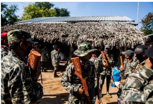
PDF fighters gather in Shauk Khar village in Ayadaw Township in February.

“When they set your house on fire, do not be sorry, be angry,” he said.