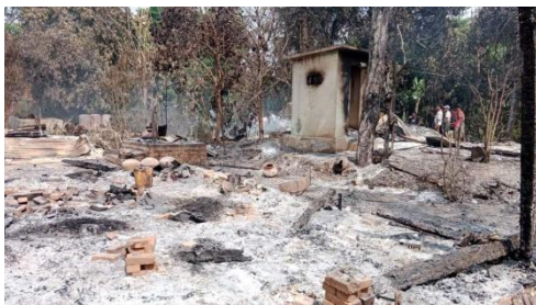
A village in Myaung Township in Sagaing Region after a regime attack on May 22.

Ye-U, Khin-U, Myaung, Yinmabin, Salingyi, Mingin, Kani, Taze, Shwebo, Wetlet, Kale and Tabayin townships in Sagaing Region have been raided by junta troops and more than 6,000 houses were burned down.