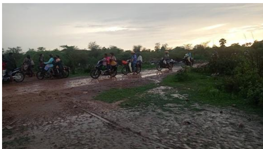
Locals displaced by military assaults on their villages flee in the rain on May 25

Residents of War Tan, as well as Done Taw, Shwe Pan Khaing, Tein Pin Kan and Thea Taw Gyi, all fled this week’s attacks, but encountered heavy rains which forced them to remain in the area.