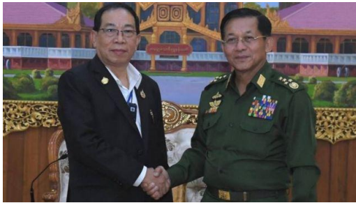
ဓာတ်ပုံ ရင်းမြစ်, CINCDS - RCSS ဥက္ကဋ္ဌ နဲ့ စစ်ကောင်စီ ဥက္ကဋ္ဌ

စစ်ကောင်စီခေါင်းဆောင် ဗိုလ်ချုပ်မှူးကြီးမင်းအောင်လှိုင်နဲ့ တွေ့ဆုံခဲ့အပြီးမှာ ရှမ်းပြည်ပြန်လည်ထူထောင်ရေးကောင်စီရဲ့ ခေါင်းဆောင်ထဲက တစ်ဦးဖြစ်သူ စိုင်းငင်းက စစ်ခေါင်းဆောင်နဲ့တွေ့ဆုံတဲ့တွေ့ဆုံရမှုအပေါ် အခုလို မှတ်ချက်ပေးခဲ့တာပါ။