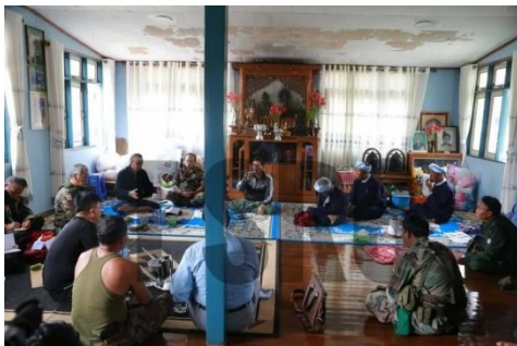
PNO မှ အစည်းအဝေးလုပ်စဉ်

မေလ ၂၆ ရက်တွင် ဆီဆိုင်မြို့နယ် ဆိုင်လဲကျေးရွာအုပ်စု ရွာပေါင်း ၃၃ ရွာကို PNO မှ စစ်သားသစ် စာရင်းကောက်ခံရန်၊ ကျပ်ငွေ ၃ သောင်း နှင့် ဆန်တပြည် ပေးရန် လာရောက်ပြောဆိုခဲ့ကြောင်း သိရသည်။