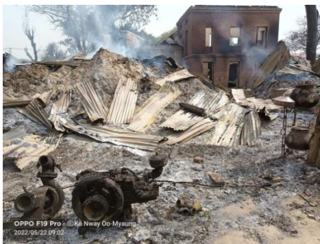
A village in Myaung Township in Sagaing Region after a regime attack on May 22.

He said: "They well know Magwe and Sagaing are under the command of the National Union Government. They are resistance strongholds. That is why regime troops target them."