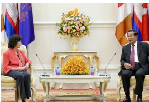
Prime Minister Hun Sen meets with UN Secretary-General's Special Envoy for Myanmar's Noeleen Heyzer on April 1. SPM

PUBLISHED 27 MAY 2022 | PHNOMPENH POST / ANN