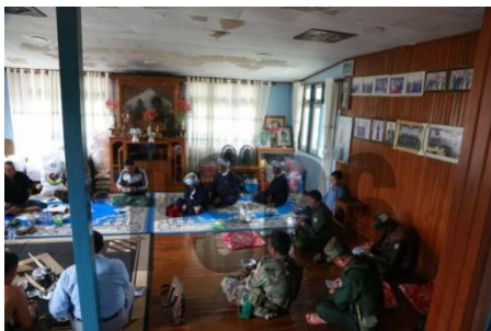
PNO မှ စည်းဝေးပြုလုပ်စဉ်

“ကျနော်တို့ ဆီဆိုင်မြို့နယ်မှာက အုပ်စုတွေများတယ်၊ နယ်မြေကျယ်တော့ တစ်ရွာကို လူငယ်အယောက် ၂၀ ပေး ဖို့ PNO တွေကအစည်းအဝေးခေါ်ပြီးတောင်းတယ်၊ဒါပေမဲ့ ကားလမ်းအရှေ့ဘက်ခြမ်းကို မကောက်ဘူး၊ သျှမ်း လူမျိုး တွေများတဲ့ ကားလမ်းအနောက်ဘက်ကိုပဲ အများစုတောင်းလာတယ်” ဟု ဆီဆိုင်မြို့နယ်မှ အမျိုးသား တစ်ဦးက သျှမ်းသံတော်ဆင့်ကို ပြောသည်။