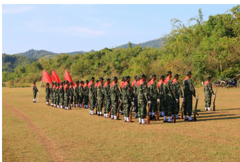
A graduation ceremony for recruits of the Palaw PDF held in February 2022

The resistance fighters launched the attack in Palaw Town's Htamin Masar village, where the junta's forces have been stationed for more than five months, a spokesperson for the Palaw PDF said. "Junta reinforcements arrived during the attack," he told Myanmar Now.