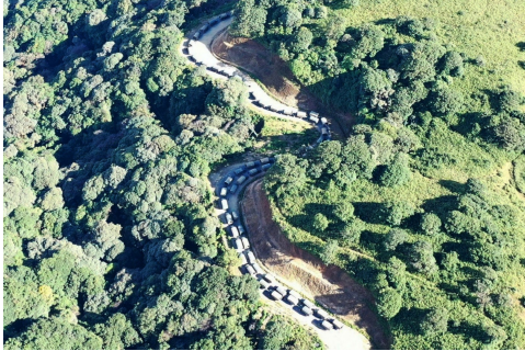
A junta convoy seen on the Mindat-Matupi road in November 2021 (CDF)

A coalition of resistance groups has said it killed at least 30 junta soldiers and injured several others last month during several ambushes against a supply convoy travelling between Magway Region and Chin State.