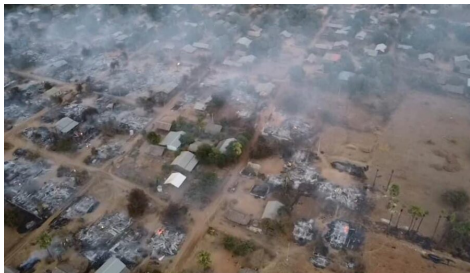
Aerial view of Thapyayaye Village, Sagaing Region, which was reduced to ashes in a junta arson attack on February 28.

Moekaung Village lies just to the north of Thapyayaye Village, which was completely torched in a junta attack on February 28 that also saw two civilians killed.