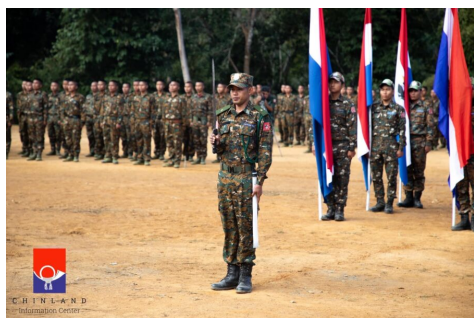
Chin National Army cadets at a graduation parade.

We can say that the regime has control in the urban areas of Chin State's townships, as well as control of roads connecting the towns, but they barely have control over rural areas.