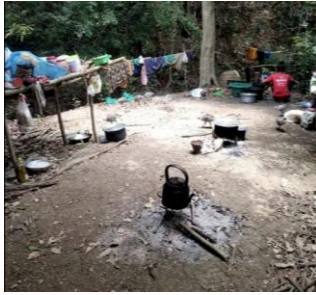
Displaced villagers shelter in a wooded area in Mon State's Bilin Township in April