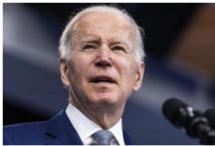
US President Joe Biden.

The United States-ASEAN Special Summit on 12 May 2022 will embolden autocratic leaders unless it directly confronts the region's worsening environment for human rights and democracy, said Human Rights Watch (HRW) in a letter to the summit's host, US President Joseph Biden.