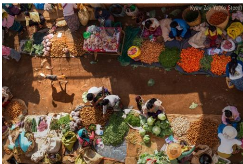
Ywar Ngarn Danu