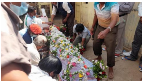
စကစ ရဲ့ ဘူဒိုဇာ နဲ့ တိုက်ခဲရတဲ့ အသက် ၉၀ကျော် အမျိုးသားနာရေး

“ကျမ ခုမှ အွန်လိုင်းစီးပွားရေးလုပ်တာ။ ဈေးရောင်းတယ်။ မလုပ်ဖူးတဲ့အလုပ်တွေလဲ လုပ်တယ်။ အရင်က မလုပ် ဖူးဘူး။ အာဏာက သူတို့လက်ထဲရှိတယ်ဆိုတော့ သူတို့ လုပ်ချင်တာ လုပ်လို့ရတယ်။ ကျမအမျိုးသားက မသေ သင့်ပဲ သေရတယ်။ လူ့အသက်ကို တန်ဖိုးထားဘူး။ ဖြစ်လာရင်တောင်တာဝန်ယူမှု မရှိဘူး။ အသက်ငယ်ငယ်နဲ့ မုဆိုးမ ဖြစ်ရတယ်။ ကလေးကလဲ ငယ်ငယ်လေးပဲ ရှိသေးတယ်” လို့ သူမက ငိုပြီး ပြောပါတယ်။