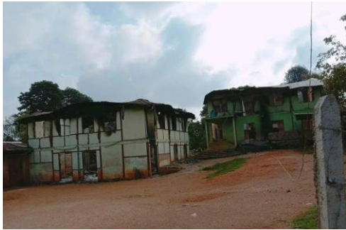
Burma Army burning villager house at Ywar Ngarn

“Nine villagers from Pae Yin Thaung village, all are Danu tribe, were tortured and killed by the military junta after accusing them as People Defense Force (PDF) members on 19 April 2022.”