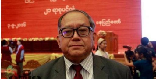
ဗိုလ်မှူး ခွန်ဥက္ကာ (PPST) အဖွဲ့ဝင်

အဲ့လိုတော့ ကျနော်တို့လည်း မသုံးသပ်။ မှတ်ချက်မပေးလိုသေးဘူးပေါ့နော်။ ကျနော်အနေနဲ့ ဒါတော့ ဗဟိုဌာနချုပ်ပေါ် မူတည်တယ်။