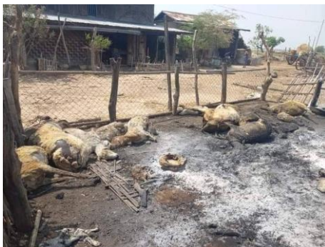
killed in fires in Thanbo. / Khin-U Township Information

Thanbo, which is home to more than 350 households, is located outside Khin-U Town. Residents did not have time to take their possessions when junta troops raided the village, firing heavy guns. The military regime forces looted valuables from homes throughout the day, before torching houses.