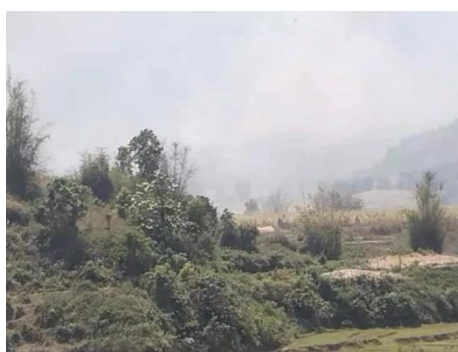
Burma Army and MNDAA Fighting Shelling Causes Fire In Muse District

Civilians evacuated when Burma Army (BA) artillery hit a sugarcane and tea field in Muse District, northern Shan State, causing a fire to spread near their village during fighting with the Myanmar National Democratic Alliance Army (MNDAA).