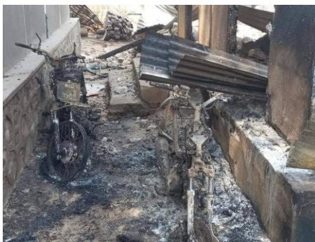
Motorbikes destroyed by fire in Thanbo. / Khin-U Township Information

“Villagers still can’t return to their homes. Only a few have returned secretly to check the situation. The regime has cut off the internet for months, and access to phone service is also on and off,” said a Thanbo villager.