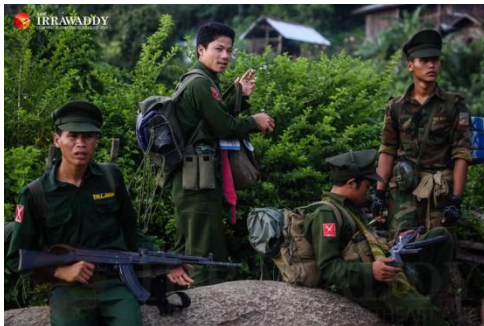
တအာန်းအမျိုးသား လွတ်မြောက်ရေး တပ်မတော် (TNLA) တပ်ဖွဲ့ဝင်များ/ဧရာဝတီ

လက်ရှိ တောင်ကြီးကားလမ်း မြောက်ဖက်တွင် ရပ်စောက်နယ်ထဲ၌ RCSS အင်အား ၂၅၀ ခန့်နှင့် ခိုလှုံ မြောက်ဖက်တွင် RCSS အင်အား ၆၀၀ ခန့်သာ ကျန်တော့သည်ဟု မြေပြင်သတင်းများအရ သိရ၏။ RCSS အနေဖြင့် ပြန်လည်ထိုးဖောက်ရန် မျှော်လင့်နေဆဲ ဖြစ်မည်။ သို့သော် SSPP နှင့် မြောက်ပိုင်းအဖွဲ့များ၏ အခိုင်အမာ နေရာယူထားမှုအား သူတဖွဲ့တည်း ပြန်လည်တုန့်ပြန်ရန် မလွယ်ကူတော့ပေ။