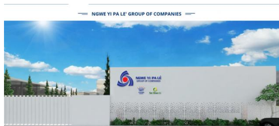
Ngwe Yi Pale Company