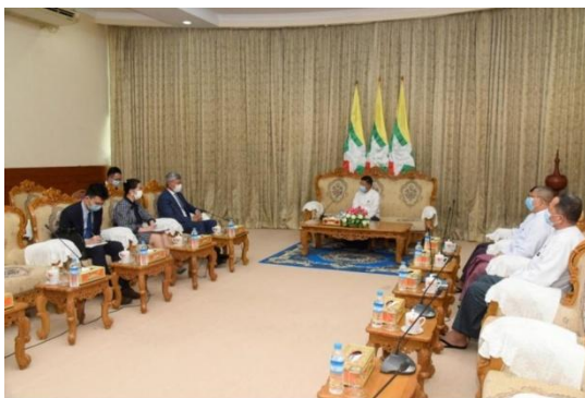
Chen Hai, China's ambassador to Myanmar, meets with the junta's Union Election Commission head U Thein Soe on April 19.

Soon after the February 1, 2021 coup, Min Aung Hlaing annulled the 2020 general election results, and said that he would organize a "free and fair" election sometime in 2023 and hand over power to the winning party. However, the Myanmar people have rejected the offer of a new poll, seeing it as another excuse by the regime to hang onto power for as long as possible.