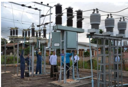
A power plant in Southern Shan state (Electricity Supply Corporation)

The anti-junta Karenni Nationalities Defence Force (KNDF) will “take action” against two army officers and some 24 men who were working for the military council's electricity department when they were arrested by resistance fighters in southern Shan State's Pekhon Township last week.