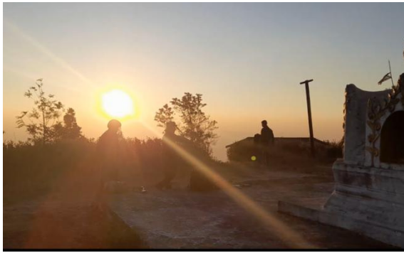
SSPP at Sa Nane Panglong

Civilians in southern Shan State are on the run after the regime began sending soldiers around Sa Nane Mountain in Panglong Township, where the Shan State Progress Party (SSPP) has a camp. Burma Army (BA) troops have been advancing into the area in Loilem District since late March.