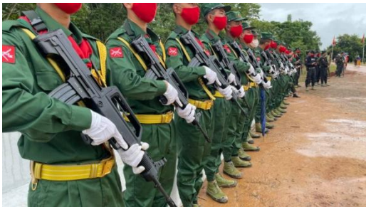
SSPP/SSA တပ်ဖွဲ့ဝင်များ

အမှန်မှာမူ စစ်အင်အား မလုံလောက်သည့် မြန်မာစစ်တပ်သည် ရှမ်းပြည်နယ်ရှိ တိုင်းရင်းသား လက်နက်ကိုင် တပ်ဖွဲ့များ လောလောဆယ် စစ်ပွဲအတွင်းပါမလာအောင် အောက်ဈေးဖြင့် အပစ်ရပ်ထားနိုင်ရေး ကြိုးစားနေသည်။ ဘိန်းဓားပြဟု ကင်ပွန်းတပ်ပြီး အပြင်းအထန် တိုက်ခိုက်ခဲ့သော လက်ရှိလည်း တိုက်ခိုက်နေသော ကိုးကန့်အဖွဲ့ခေါင်းဆောင် ဖုန်ကြားရှင်း အသုဘသို့ မြန်မာစစ်တပ်ခေါင်းဆောင်ကိုယ်တိုင် လွှမ်းသူပန်းခွေပို့ပြီး စစ်တိုင်းမှူးတဦးကိုပင် ကိုယ်စားစေလွှတ်ခဲ့၏။ ရှမ်းပြည်နယ်ရှိ တိုင်းရင်းသားတပ်ဖွဲ့များ လက်ရှိ စစ်ပွဲအတွင်း ပါမလာအောင် အတော်လေး အောက်ကျခံပြီး ကြိုးပမ်းနေသည်။