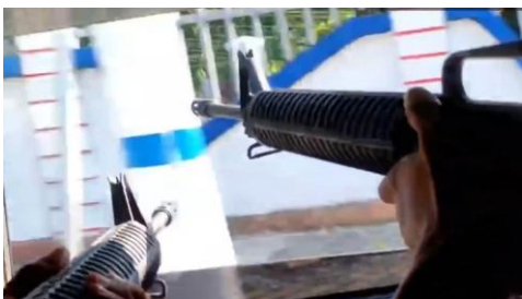
A video posted to social media purports to show anti-junta fighters opening fire on a military outpost on Yangon's Inya Road, On April 11, 2022.

KNU officials have reported daily clashes in areas under their administration, including the townships of Kawkaik and Kya Inn Seik Kyi, and say they are likely to intensify.