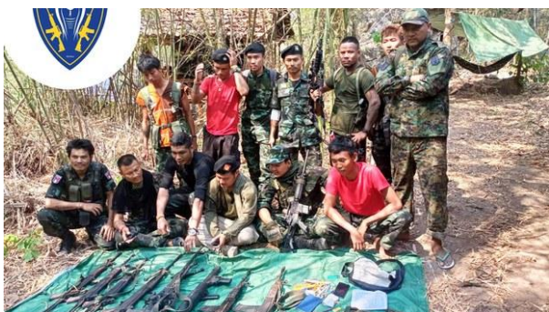
KNLA fighters pose with weapons confiscated from the military during the battle of Lay Kay Kaw, April 10, 2022.

Heavy fighting between junta troops and a joint force of ethnic fighters and prodemocracy paramilitaries in Myanmar’s Kayin state resulted in the largest number of casualties the military has suffered in clashes since it seized power last year, according to sources.