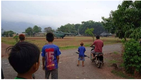
SAC Helicopter landing at Ayetharyar 8 April 2022

Meanwhile, the Burma Army or Tatmadaw is said to be reinforcing its troops in Lawksawk Township, according to the Shan News of April 8.