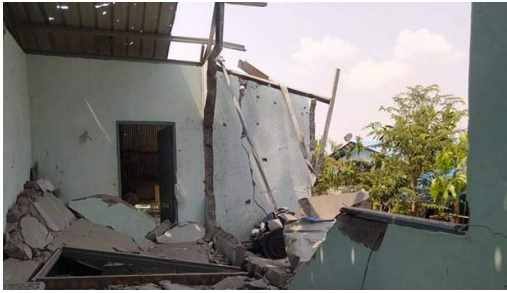
A school destroyed by a military airstrike in Lay Kay Kaw, April 11, 2022.Refugees face food shortage

Attempts by RFA to contact junta Deputy Information Minister Zaw Min Tun for comment on the fighting went unanswered Monday.