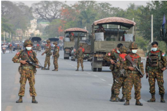
Myanmar soldiers stand guard on a road amid demonstrations against the military coup in Naypyidaw.

Campaign group Progressive Voice has drawn attention to how the junta has been abusing children and called for the international community to “wake up and pivot away from a ‘business as usual’ [attitude] towards the military junta”.