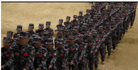
Peoples Defence Force PDF Battalion 509

Scores of Burma Army (BA) soldiers were killed during a two-day battle with the People’s Defence Force (PDF) Battalion 509 that erupted after the civilian resistance group destroyed a Mytel communications tower near Khe Moon village in Nawngkio Township, northern Shan State.