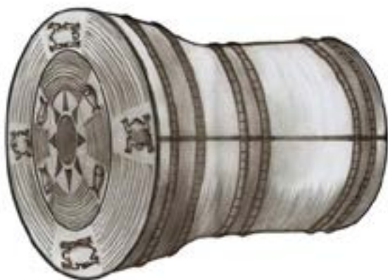
ကယားတိုင်းရင်းသားတို့၏ ဖားစည်