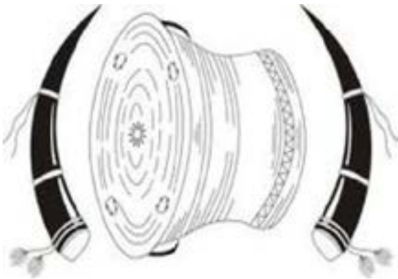
ကရင်တိုင်းရင်းသားတို့၏ ဖားစည်နှင့် ကွဲချို

တိုင်းရင်းသားလူမျိုးပေါင်းစုံနေထိုင်ကြသော မြန်မာနိုင်ငံတွင် တိုင်းရင်းသားလူမျိုး အသီးသီးတို့၏ ရှေးယခင်အဆက်ဆက်မှ တန်ဖိုးထား ထိန်းသိမ်းထားခဲ့ကြသော ဆိုင်ရာဆိုင်ရာ အမျိုးသားသင်္ကေတများရှိကြပါသည်။ တိုင်းရင်းသားတစ်မျိုးချင်းစီ၏ အတွေးအခေါ် အမြင်အမြင်၊ လူမှုရေး၊ ဓလေ့ထုံးတမ်း၊ ယဉ်ကျေးမှု၊ ရှင်သန်နေထိုင်မှုပုံစံ နှင့် သမိုင်းအစဉ်အလာများကို ၎င်းတို့အမြတ်တနိုးတန်ဖိုးထားသော သင်္ကေတ များတွင် ထင်ရှားတွေ့နိုင်ပါသည်။ တိုင်းရင်းသားလူမျိုးတစ်မျိုးနှင့် တစ်မျိုး ပိုမိုနားလည်မှုရှိလာပြီး ရှေ့ရှည်တည်တံ့သော ယုံကြည်မှုတည်ဆောက်နိုင်ရန်အတွက် တစ်ဦးမှ တန်ဖိုးထားသော အမျိုးသားသင်္ကေတနှင့် လက္ခဏာများကို တစ်ဦးက လေ့လာအဓိပ္ပာယ်ဖော်ဆောင်တတ်ရန်လည်း အလွန်ပင်အရေးကြီးပါသည်။ အမျိုးသား ပြန်လည်သင့်မြတ်ရေးကို ကြိုးပမ်းနေသော ဤကာလတွင် ပို၍ပင် အရေးကြီးပါသည်။ တိုင်းရင်းသားလူမျိုးများစွာရှိသော်လည်း အချို့ကိုသာ ဖော်ပြရခြင်းမှာ ထိမ်ချန် ထားလိုသော ရည်ရွယ်ချက်မဟုတ်ပါ။ လက်လှမ်းမှီစုဆောင်းနိုင်ခဲ့သော အချို့ သင်္ကေတများကိုသာ ဖော်ပြခြင်းဖြစ်ပါသည်။