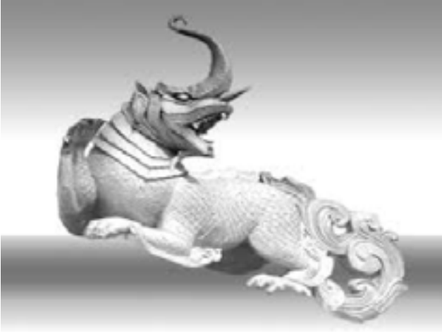
ရခိုင်တိုင်းရင်းသားတို့၏ သင်္ကေတတစ်မျိုးဖြစ်သော Byala