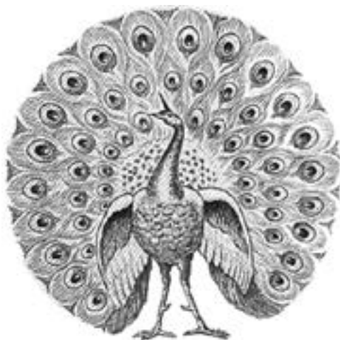
ဗမာတိုင်းရင်းသားတို့၏သင်္ကေတ တစ်မျိုးဖြစ်သော ဒေါင်းငှက်