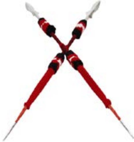
နာဂတိုင်းရင်းသားတို့၏ သင်္ကေတတစ်မျိုးဖြစ်သော လှံ