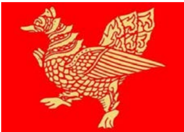
မွန်တိုင်းရင်းသားတို့၏သင်္ကေတ တစ်မျိုးဖြစ်သော ဟင်္သာငှက်