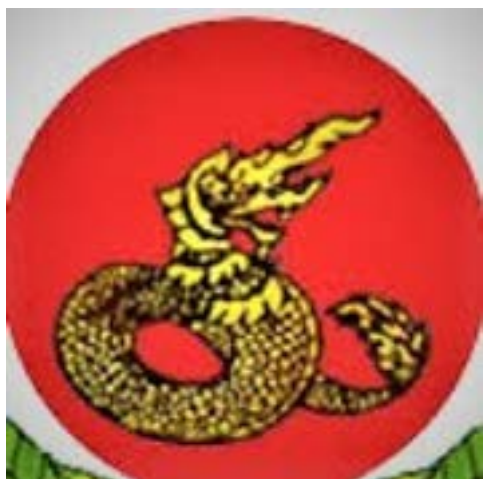
တအာင်း (ပလောင်) တိုင်းရင်းသားတို့၏ သင်္ကေတတစ်မျိုးဖြစ်သော နဂါး