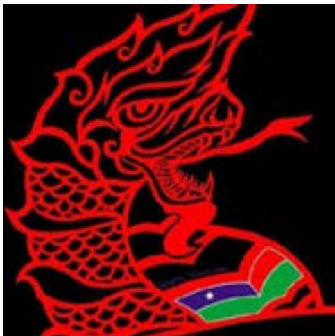
ပအိုဝ်းတိုင်းရင်းသားတို့၏ သင်္ကေတတစ်မျိုးဖြစ်သော နဂါး