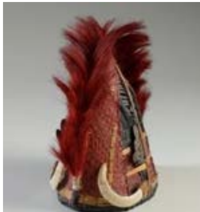
နာဂတိုင်းရင်းသားတို့၏ သင်္ကေတတစ်မျိုးဖြစ်သော ဦးထုပ်