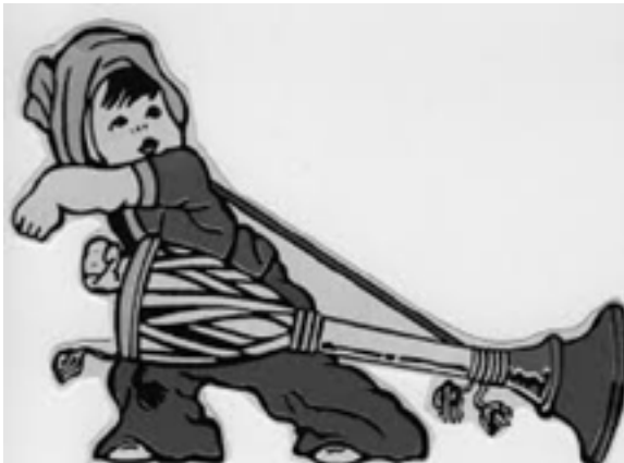
ရှမ်းတိုင်းရင်းသားတို့၏ သင်္ကေတတစ်မျိုးဖြစ်သော ရှမ်းအိုးစည်