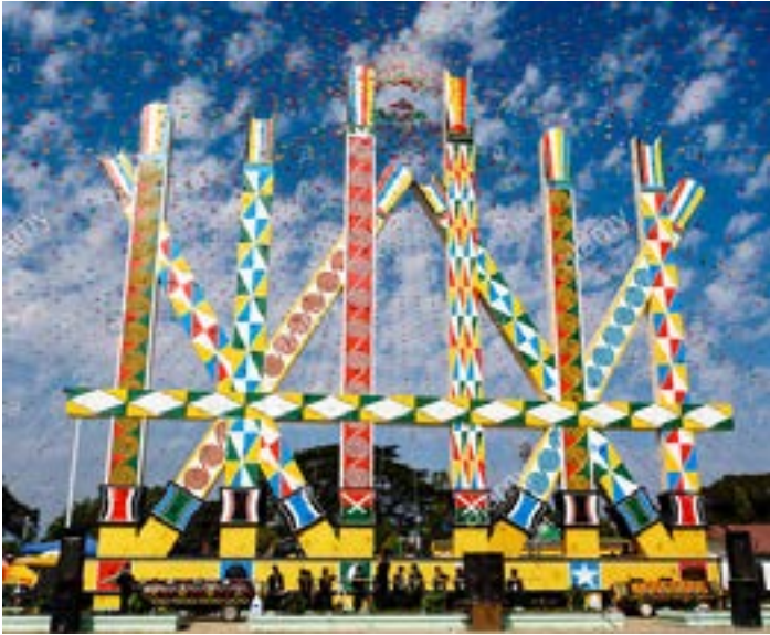
ကချင်တိုင်းရင်းသားတို့၏သင်္ကေတတစ်ခုဖြစ်သော မနောတိုင်