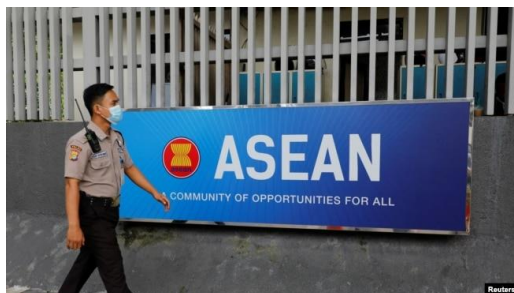
FILE - A security officer walks past the Association of Southeast Asian Nations (ASEAN) sign as he guards outside its secretariat building in Jakarta, Indonesia, Oct. 27, 2022.

The Chinese premier also signed off on 18 protocols with Cambodia, which included health care, support for Phnom Penh hosting next year's Southeast Asian Games and assistance to improve the livelihoods of "Cambodian citizens."