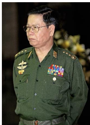
General Khin Nyunt attends a summit in Bagan on Nov. 12, 2003.

The Southeast Asian nation has been in revolt since the takeover as the vast majority of the people reject the coup. Many young people have taken up arms to fight against the junta.