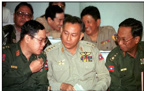
Military intelligence officers Colonel Kyaw Thein (left), Colonel Thein Swe (center) and then Myanmar regime No. 2 Colonel Kyaw Win consult before answering a journalist’s question during the monthly government press conference on Feb. 1, 1997.

As part of the then regime’s propaganda campaign in which it sought to counter media with media, the Myanmar Times, a media outlet in which the head of the MI’s international relations department, Brig-Gen Thein Swe, and his son Sonny Swe had a stake, published an English-language journal serving as the mouthpiece of military leaders, and as their propaganda machine. While all other media outlets faced draconian censorship, the Myanmar Times was the only media outlet privileged by the regime.