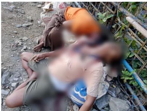
ဆင်အင်းကြီးရွာမှ သတ်ဖြတ်ခံထားရသူများ

၎င်းက “သတင်းစာ ရှင်းလင်းပွဲမှာ ရခိုင်မှာ စစ်ပြန်ဖြစ်ရင် အဆိုး မဆိုနဲ့လို့ ဇော်မင်းထွန်း ပြောကတည်းက အရပ်သား တွေကို ပစ်မှတ်ထား တိုက်ခိုက်ဖို့ သူတို့ မှတ်တမ်းတင်ပြီးသား ဖြစ်တယ်။ အခု တကျော့ပြန်တိုက်ပွဲမှာ AA ကို မြေပြင် မှာ မနိုင်တဲ့အတွက် အရပ်သားတွေကို ပစ်မှတ်ထားပြီး တိုက်ခိုက်လာတာဖြစ်တယ်။ ဒီထက် ဆိုးဆိုးဝါးဝါး လူမျိုးတုံး သတ်ဖြတ်မှုတွေကို ပါလုပ်လာနိုင်တဲ့အတွက် မီဒီယာသမားတွေအပါအဝင် နိုင်ငံတကာ အဖွဲ့အစည်းတွေက စောင့်ကြည့်ပေးကြပါလို့ တိုက်တွန်းချင်ပါတယ်” ဟု ဧရာဝတီသို့ မှတ်ချက်ပြု ပြောဆိုသည်။