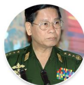
Gen Khin Nyunt

At least 200 political prisoners given lengthy sentences died in prison due to poor conditions, abuses and lack of access to proper medical treatment, according to data from the Assistance Association for Political Prisoners.