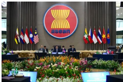
The Special Asean Foreign Ministers' Meeting in Jakarta on October 27, 2022.

Civil society organisation (CSO), Fortify Rights, has criticised the Association of Southeast Asian Nations (ASEAN) following the leak of an official ASEAN document that proposes appeasing the Myanmar junta and maintaining the status quo in Myanmar.