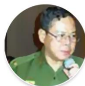
Brig-Gen Kyaw Thein