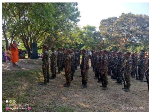
A military council combat training in Sagaing

"Those who didn't get chosen were relieved," said a Ngar Toet local whose name was among those who had been called. "Nearly all the ones who were chosen went to the training, by force."