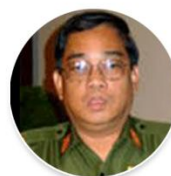
Brig-Gen Than Tun