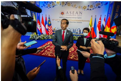
Indonesia's President Joko Widodo speaks to the media during ASEAN summit in Phnom Penh, Cambodia, Friday, Nov. 11, 2022.

The call for tangible progress comes as human rights groups assail ASEAN’s failure to pressure the Myanmar junta, which has largely ignored the Five Point Consensus and resisted dialogue with representatives of the civilian administration it ousted. Instead, the military has dubbed many of its key political opponents as terrorists or outlaws and waged a scorched earth campaign in the Burmese heartland.