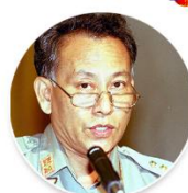
Brig-Gen Thein Swe