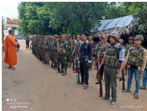
Pyu Saw Htee group seen in Sagaing

Locals speculated that Ngar Toet was selected as a training site due to its location, just two miles from the junta stronghold of Kanbalu town, and near the base of a tank battalion. One-third of the village's residents were also historically supporters of the USDP and the military's claim to political power.