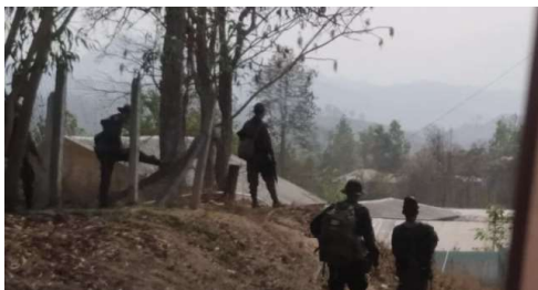
Photo_ပုံဟောင်း(Ka hsaw Wah )

ဖေဖော်ဝါရီ ၁၆ ရက်၊ ၂၀၂၂ ခုနှစ်။ ကေအိုင်စီ