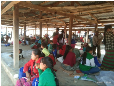
Mong Yaw IDPs at Mongyaw market 15 Feb 2022

According to a local source who asked not to be named, mostly elderly people, women and children fled the Mong Yaw area in vehicles or on motorbikes when the regime attacked with fighter jets. The man believes that many of the men stayed behind to take care of their properties and farms in Lashio Township.