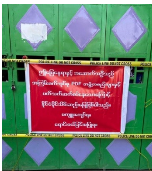
The confiscated office of Mahar Rescue group.

Last week in Mandalay, all property belonging to the Mahar Rescue group, which is providing free health care for COVID-19 sufferers in the city, was sealed off for allegedly associating with people's defense forces. At least eight members of the group were detained during the raid.