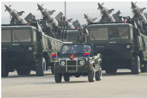
၂၀၁၆ ခုနှစ်တပ်မတော်စစ်ရေးပြ အခမ်းအနား။

စစ်ကောင်စီကို ထောက်ပံ့ဖို့ လက်နက်ပစ္စည်းတွေ သယ်လာတယ်လို့ ယူဆရတဲ့ အီရန်လေယာဉ်တစ်စင်း ဖေဖော်ဝါရီ ၁၆ ရက် ဒီနေ့ နံနက်ပိုင်းက နေပြည်တော်လေဆိပ်ကို ဆိုက်ရောက်ခဲ့တယ်လို့ ဟောင်ကောင်အခြေစိုက် အေးရှားတိုင်းမ်စ်သတင်းက ဖော်ပြလိုက်ပါတယ်။