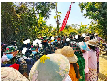
မကွေးတိုင်း အတွင်း လှုပ်ရှားနေသည့် ပြည်သူ့ကာကွယ်ရေးတပ်များ

ဆောမြို့နယ်အတွင်းရှိ Non-CDM ဝန်ထမ်းများ အားလုံးကိုလည်း ဖေဖော်ဝါရီ ၅ ရက်၊ ည ၁၂ နာရီ နောက်ဆုံးထားပြီး ပြည်သူ့ရဲခွင် ခိုလှုံရန် ဆော ပအဖက ဇန်နဝါရီ ၃၀ ရက်စွဲဖြင့် သတိပေးစာ ထုတ်ပြန်ခဲ့သည်။