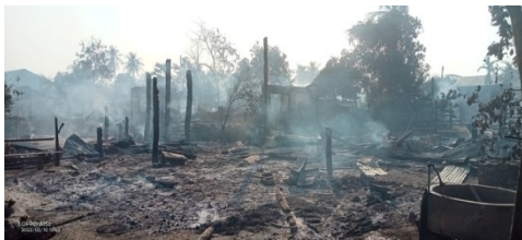
Burnt homes in Sagaing's Mauktat village, Feb. 10, 2022.

“I am grieving over our losses, but I don’t want to be lost in despair. I try to encourage myself and others to remain active. We heard homes in other villages were burned down, so we knew this could happen to us one day.”