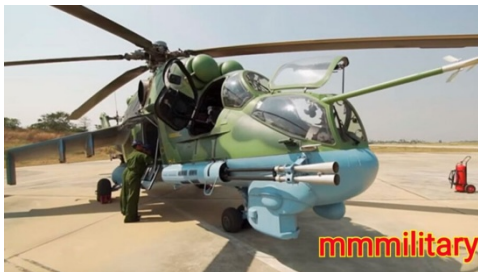
A Russian-made Mi-24 attack helicopter of the Myanmar Air Force

The Russian pilots have arrived as the military regime mounts increasingly frequent air attacks on ethnic armed organizations fighting for greater autonomy and on local People's Defense Force groups that emerged after the military coup last year. The visit also coincides with attacks on the houses of Myanmar junta pilots allegedly involved in junta airstrikes after their names and addresses were leaked on social media.