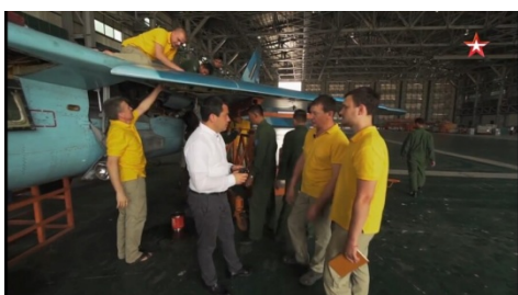
Russian technicians are seen at a military hangar in 2018.