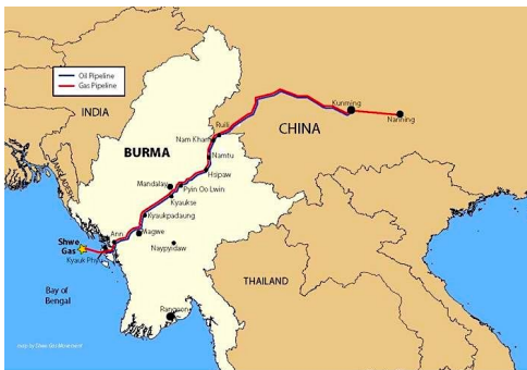
ရေနံနှင့် သဘာဝဓာတ်ငွေ့ ပိုက်လိုင်း ဖြတ်သန်းရာ လမ်းကြောင်းပြ မြေပုံ / Shwe Gas

ရခိုင်ပြည်နယ်ကမ်းရိုးတန်းမှ တရုတ်နိုင်ငံတောင်ပိုင်းအထိ ရှည်လျားသော ထိုရေနံနှင့် သဘာဝဓာတ်ငွေ့ ပိုက်လိုင်းများကို ၂၀၁၁ ခုနှစ်တွင် စတင်တည်ဆောက်ပြီး ၂၀၁၃ ခုနှစ်၊ ဇူလိုင်လတွင် လုပ်ငန်းများ စတင်လည်ပတ်ခဲ့သည်။