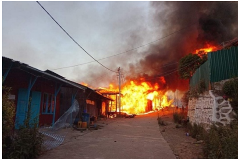
Fire engulfs homes in Thantlang in January

The Myanmar army set fire to more homes in the deserted Chin State town of Thantlang this week, the Chin Human Rights Organisation (CHRO) reported.