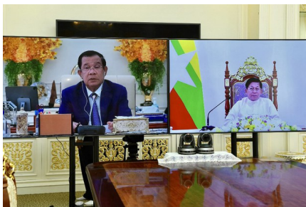
Cambodia's Prime Minister Hun Sen (L) and Myanmar's military chief Min Aung Hlaing (R) on screens during their video meeting, Jan. 26, 2022.

Only a month and a half into assuming the rotating leadership of ASEAN, Cambodia's prime minister admitted that Myanmar's military regime has made no progress in resolving the situation in the country and said