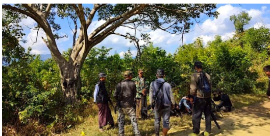
ဗိုလ်နဂါးဦးဆောင်သည့် မြန်မာ တော်ဝင်နဂါး တပ်ဖွဲ့ဝင်များ

ယင်းနေ့ တိုက်ခိုက်မှုတွင် ပြည်သူ့ကာကွယ်ရေးတပ်ဖွဲ့များဘက်မှ ၁ ဦး ကျဆုံးပြီး ၄ ဦး ဒဏ်ရာ ရရှိခဲ့ကြောင်း သိရ သည်။