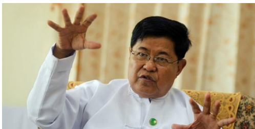
ဦးစိုးသိန်း

သူသည် ရေတပ်ဗိုလ်ချုပ်ဟောင်းနှင့် ဝန်ကြီးဟောင်း ဦးစိုးသိန်း၏ သားဖြစ်သည်။ ဦးစိုးသိန်းသည် မြန်မာတွင် စစ်အာဏာရှင်စနစ် အဆုံးသတ်သွားပြီဖြစ်ကြောင်း အရပ်သားအစိုးရအတုက ၂၀၁၂ ခုနှစ်တွင် ကမ္ဘာကို လိမ်လည်ရာတွင် ကူညီခဲ့သူဖြစ်ပြီး ယခုအခါတွင် စစ်ကောင်စီကို အမာခံထောက်ခံသည့် သဘောထားတင်းမာသူ ဖြစ်သည်။