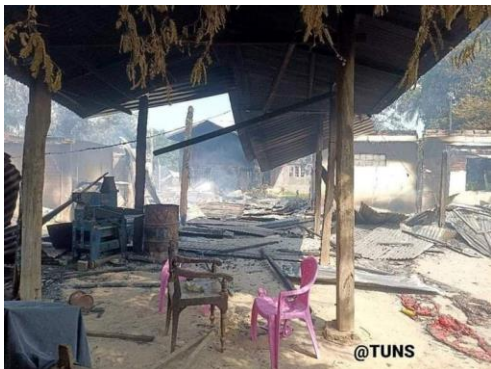
အောက်တိုဘာ ၁၉ ရက်က သပြေရင်းကျေးရွာအား မီးရှို့ထားရမှုများ မြင်တွေ့ရစဉ်

သပြေရင်းရွာ ဒေသခံ တဦးက “လက်ရှိမှာက ကိုယ့်ရွာကိုလည်း မပြန်ရဲသေးတော့ တောထဲမှာပဲ ဖြစ်သလို နေကြရတာပေါ့၊ သူတို့နဲ့ လွတ်မယ် ထင်တဲ့ နေရာတွေကို ပြေးကြရတာပေါ့၊ အချို့က အမျိုးအဆွေရှိတဲ့ ရွာတွေဘက်၊ အချို့ကလည်း တောဘက်ပေါ့၊ ကိုယ့်အရပ်မှာပဲ အေးအေးချမ်းချမ်းလေး လုပ်ကိုင် စားသောက်ချင်တာပေါ့။ သူတို့ လာတိုင်း ပြေးနေရတာ ဘယ်လိုမှ အဆင်မပြေဘူး” ဟု ပြောသည်။