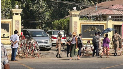
The entrance to Insein Prison in Yangon, Feb. 12, 2022.

Many prisoners in Myanmar rely on food from families and friends to supplement their poor prison diet.