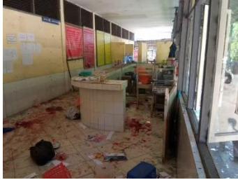
The blast site in Insein Prison.

Myanmar's civilian National Unity Government (NUG) and revolutionary forces have condemned the bombing of Insein prison in Yangon, which left eight people dead on Wednesday morning.