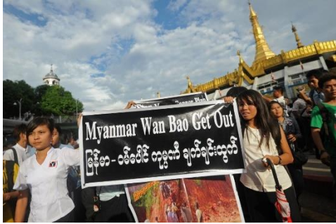
People protest against the Wanbao mine in Yangon in 2012.