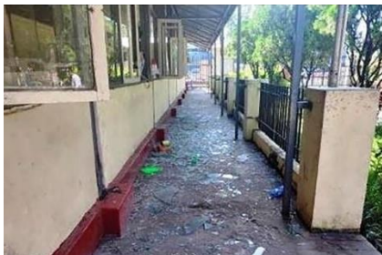
A parcel-reception location at the entrance of Insein Prison was damaged by an explosion in Yangon, Myanmar, Oct. 19, 2022.

“Family visits, sending parcels to the prisoners, the prison courts are all suspended,” he said. “When we ask how long this ban is going to be in effect, they say they can only answer when they get the order from the Ministry of Interior.”