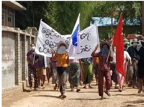
An anti-regime protest in Nyaung-U township, Mandalay region on May 31, 2021.

Nearly a dozen people, including members of Myanmar's deposed National League for Democracy (NLD) party, have been killed in three townships in Mandalay region on three successive days, locals said Wednesday.