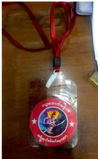
Thwe Thout's logo on a lanyard left on a victim.

The General Strike Committee in Taungtha claimed that the township's general administration department must take responsibility for the killing as it was involved in his arrest.