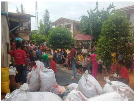
နမ္မတူမြို့နယ်ရှိ စစ်ရှောင်များ

“အားလုံးက ဒီနေ့မနက်မှာပဲ ပြန်သွားကြပါတယ်။ ကားတွေကို ငှားပြန်တဲ့သူရှိတယ်။ ထော်လာဂျီနဲ့ ပြန်တဲ့သူတွေ ရှိတယ်။ ရွာတွေဘက်မှာ တိုက်ပွဲငြိမ်သွားလို့ ပြန်သွားကြတာတဲ့” ဟု အထက်ပါ ပုဂ္ဂိုလ်က ပြောသည်။