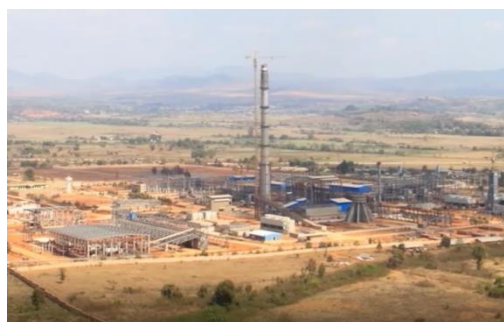
Pinpet steel mill

She said the joint venture between Russian-backed Tyazhpromexport and Myanmar Economic Corporation to reopen the mill, which was closed five years ago, has been in the works since May last year and that three companies are involved in reconstruction and expansion.