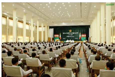
USDP members attend the first day of the party conference on October 4

While some major changes were made, however, the composition of the USDP's central executive committee (CEC) remained largely the same after the conference. According to Myanmar Now's source, most of the CEC's 50 members have retained their positions.